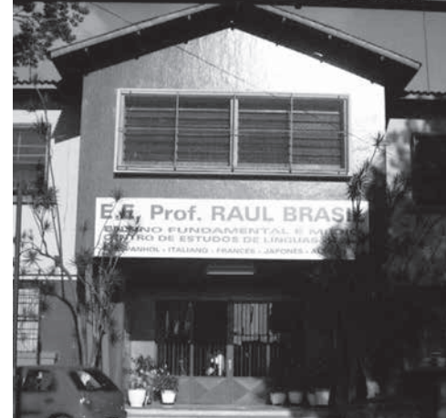
事件が発生した聖州スザノ市立ラウル・ブラジル校 (google street view)

【既報関連】17歳の生徒R.M.O.を、襲撃事件をそのかした共犯として捜査していると、12日付付紙が報じた。R.M.O.が書いたメッセージの中で、特に捜査されたのは「学校の食堂で爆弾を爆発させた」の部分だ。警察に呼ばれて供述したR.M.O.が共犯だと見做されて排除された。市警、検察が11日に