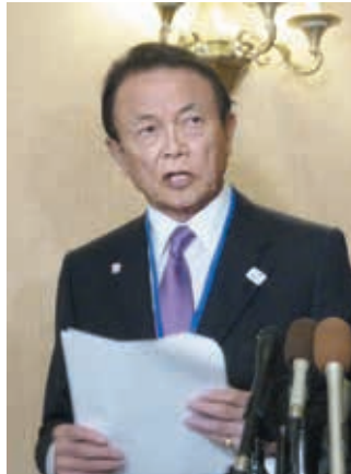
G20財務相・中央銀行総裁会議の初日の討議後、記者団の取材に応じる麻生財務相＝11日、ワシントン（共同）

【ワシントン共同】早田栄介（日米欧と新興国の20カ国・地域（G20）財務相・中央銀行総裁会議）が11日夜（日本時間12日午前）、米首都ワシントンで開幕し、初めて日本が議長国となった今年のG20閣僚会議が開始した。米中貿易摩擦で主要国経済が減速感に覆われる中、麻生太郎財務相は初日の討議で「国際協調の精神が重要だ」と訴えた。日本は世界同時不況に至る芽を摘んで成長を取り戻すため、2日間の会議を通じて結束を呼び掛ける考えだ。