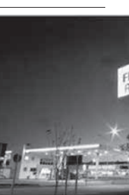
フランゴ・アツサード

ファストフード・チェーンのフランゴ・アツサードを展開するインターナショナル・ミール・カンパニー(IMC)が、高速道路沿いのガソリンスタンド内の敷地の買収に向けた交渉を進めている。同社の最大の取引になるもので、既にサンパウロ州内1040カ所をマッピングし、100カ所を