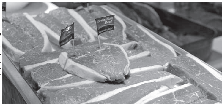
ドイツのコンサルティンゲ会社ローランド・バーガーの分析によると、東南アジア12カ国の食肉消費は、2018年に世界の食肉需要の

8%に相当する3億5680万トンに記録して、2023年までに年率2.6%増加する見込みだ。この伸び率は、年率平均1.13%増を見込む世界の食肉消費の伸び率を上回る。ブラジルは、現時点でこの市場に積極的にかかわっているわけではないが、その将来は非常に有望だ。ブラジルの肉類輸出事業者協会(ABIEC)のデータによると、ブラ