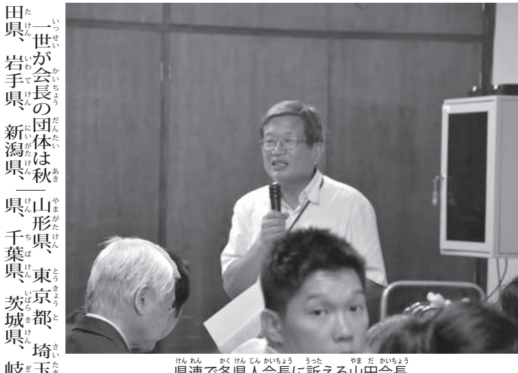
県連で各県人会長に訴える山田会長