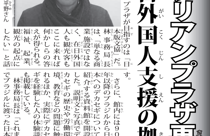
再開したブラジリアンプラザが目指すのは「日本版文協」だ。

再開したブラジリアンプラザが目指すのは「日本版文協」だ。林事務局局長は「単なる商業施設ではなく、在日外国人も観光客もここに集まれる。何かしらの答えが得られる。福社、起業、観光の起点にしたい」と話