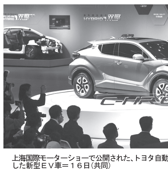
上海国際モーターショーで公開された、トヨタ自動車の「C-HR」をベースにした最新型EV車＝16日

【上海共同】世界有数の規模を誇る自動車展示会「上海国際モーターショー」が16日、中国上海市で開幕した。世界最大の自動車市場と見られる中国では、最近急速な伸びを見せているEV（電気自動車）の競争が激化している。世界20カ国・地域から千社を超える自動車関連企業が参加している。展示面積は約36万平方メートル。トヨタ自動車は「C-HR」をベースにした最新型EV「C-HR EV」を披露した。また、本田は「フィットEV」も展示した。中国のEV市場は、2020年に100万台を突破する見込みである。トヨタは、中国市場へのEV戦略を強化し、今年度後半までに10万台のEVを中国市場に導入する計画を発表した。