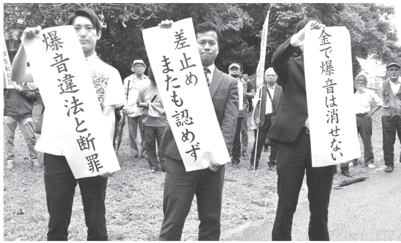
第2次普天間爆音訴訟の控訴審判決を受け、垂れ幕を掲げる原告側の弁護士ら＝16日午後、那覇市（共同）

【共同】米軍普天間飛行場（沖縄県宜野湾市）周辺の住民ら約3400人が、米軍機の飛行騒音による健康被害の賠償を国に求めた第2次普天間爆音訴訟の控訴審判決で、福岡高裁那覇支部は16日、「騒音は受忍限度を超えている」として、国に約21億2100万円の賠償を命じた。飛行差止めや将来生じる被害の賠償は、一審に続いて認めず、賠償基準額を大幅に引き下げた。 普天間飛行場は、米軍普天間飛行場（沖縄県宜野湾市）周辺の住民ら約3400人が、米軍機の飛行騒音による健康被害の賠償を国に求めた第2次普天間爆音訴訟の控訴審判決で、福岡高裁那覇支部は16日、「騒音は受忍限度を超えている」として、国に約21億2100万円の賠償を命じた。飛行差止めや将来生じる被害の賠償は、一審に続いて認めず、賠償基準額を大幅に引き下げた。 普天間飛行場は、米軍普天間飛行場（沖縄県宜野湾市）周辺の住民ら約3400人が、米軍機の飛行騒音による健康被害の賠償を国に求めた第2次普天間爆音訴訟の控訴審判決で、福岡高裁那覇支部は16日、「騒音は受忍限度を超えている」として、国に約21億2100万円の賠償を命じた。飛行差止めや将来生じる被害の賠償は、一審に続いて認めず、賠償基準額を大幅に引き下げた。