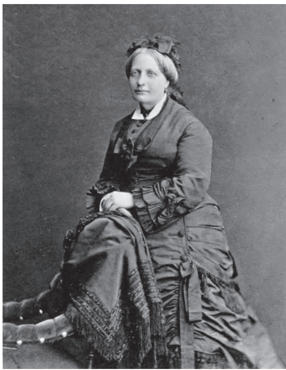
テレサ・クリスティーナ皇后 (Adele Perlmutter-Heilperin (founded her studio in 1862) [Public domain])