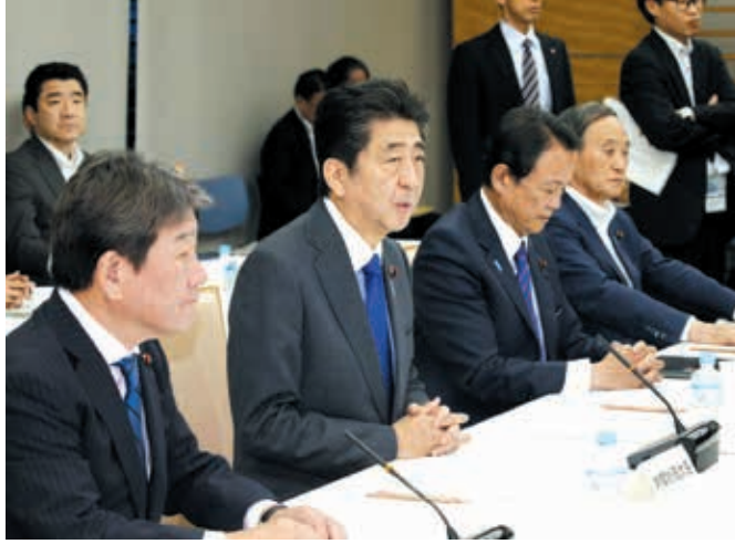
政府が「骨太方針」案を示した経済財政諮問会議で発言する安倍首相＝11日午後、首相官邸

【共同】政府は11日の経済財政諮問会議で、経済財政運営の指針「骨太方針」の案を示した。働いて一定の収入がある人の年金を減額する在職老齢年金制度は「将来的な廃止も展望しつつ見直す」と明記。バブル崩壊後の「就職氷河期世代」のうち困難な状況にある約100万人向けの支援プログラムも盛り込み、この世代の正規雇用者を3年間で30万人増やす目標を掲げた。企業が支払う最低賃金は、全国平均の時給が「より早期に千円になることを目指す」と引き上げ加算を促した。21日をめどに閣議決定する。