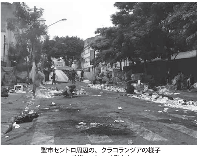
聖市セントロ周辺の、クラコランジアの様子