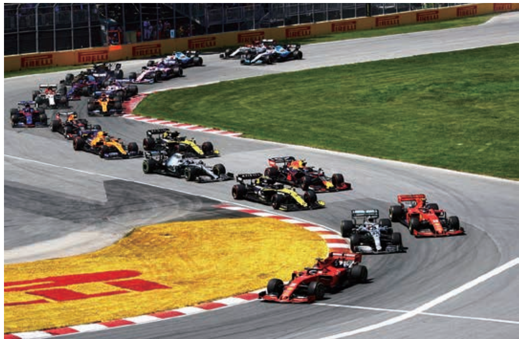
Sebastian Vettel da Ferrari fez a pole position e manteve a ponta durante toda a corrida, mas uma punição de 5 segundos fez com que o tetracampeão terminasse em segundo lugar.

Inglês pentacampeão conquistou sua 78ª vitória na categoria e agora está a apenas 13 vitórias do recorde de Michael Schumacher