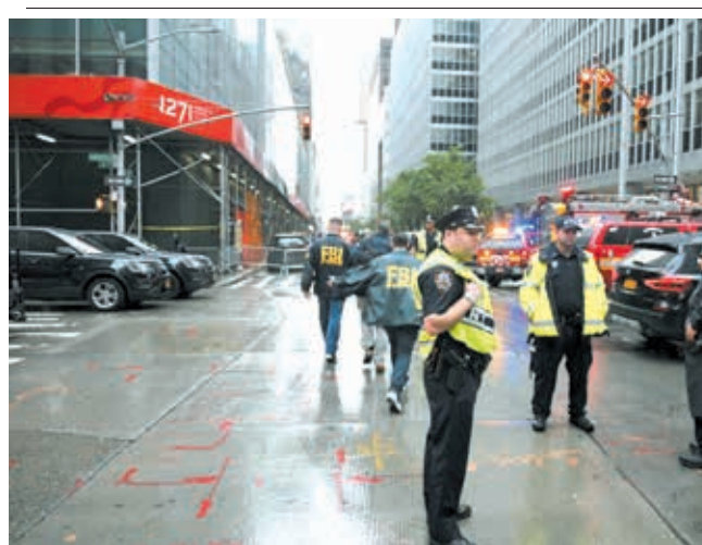
10日、ヘリコプターが不時着したビルの近くで立ち入りを規制する警官＝米ニューヨーク

トランプ氏は通商問題を協議するための首脳会談に同意を示している。米連邦準備制度理事会（FRB）の金融政策に「われわれは利便性を下げていない。FRBが優位でない」とも破壊的だ」と批判した。