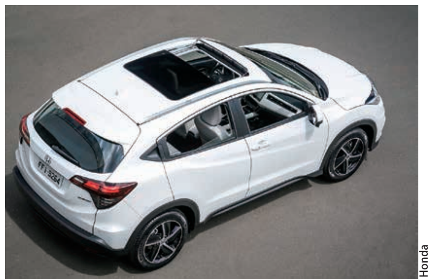
Teto solar panorâmico, motor 1.5 turbo e elevado valor de revenda, estão entre os principais atrativos do modelo.

de estacionamento dianteiros e traseiros, câmera de ré (com 3 modos de visualização) e o sistema Honda LaneWatch, o HR-V Touring proporciona excelente visibilidade nas manobras. Devido a maior potência do motor o modelo recebeu uma nova calibragem para o conjunto de suspensão, com novas molas e amortecedores, barra estabilizadora dianteira de maior diâmetro e a tecnologia Agile Handling Assist (AHA), que aprimora a estabilidade dinâmica do SUV em curvas.