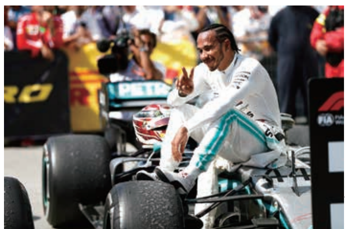
Com a vitória no Canadá o inglês Lewis Hamilton da Mercedes caminha para a conquista do hexacampeonato mundial da F-1.

possível com os pneus que o inglês havia largado, mas na volta seguinte, Hamilton informou que os compostos estavam desgastados e foi para os boxes para a troca dos pneus. Na vigésima nona volta, Leclerc liderava seguido por Vettel, Hamilton, Bottas, Verstappen, Ricciardo e Hulkenberg. Na 58ª volta, a direção de prova puniu Vettel devido a uma manobra perigosa do alemão que entrou muito forte na curva, derrapou e voltou para a pista espremendo Hamilton no muro de proteção. Faltando cinco voltas para o final, Lewis Hamilton apertou o ritmo e foi para cima da Ferrari de Sebastian Vettel para vencer a prova na pista e não depender dos cinco segundos de punição do alemão para vencer a prova, mas o alemão resistiu à pressão e terminou na frente de Hamilton. A melhor volta da prova foi do finlandês Valtteri Bottas da Mercedes que terminou em quarto, com Max Verstappen em quinta após uma corrida de recuperação por ter largado na décima primeira posição. O holandês Max Verstappen da Red Bull foi o piloto melhor colocado com motor Honda. Verstappen largou em décimo primeiro e terminou na quinta posição. Seu companheiro de equipe o francês Pierre Gasly terminou em oitavo.