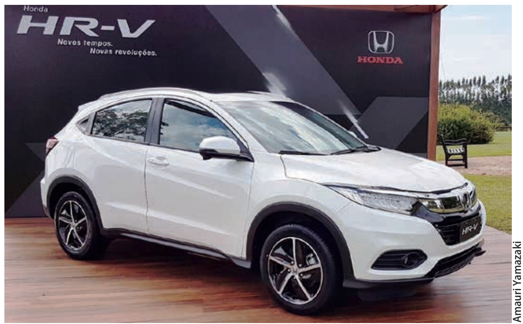
Honda HR-V Touring modelo 2020 já está nas concessionárias.

Motor 1.5 turbo com 173 cv de potência e teto solar panorâmico estão entre os principais destaques do SUV