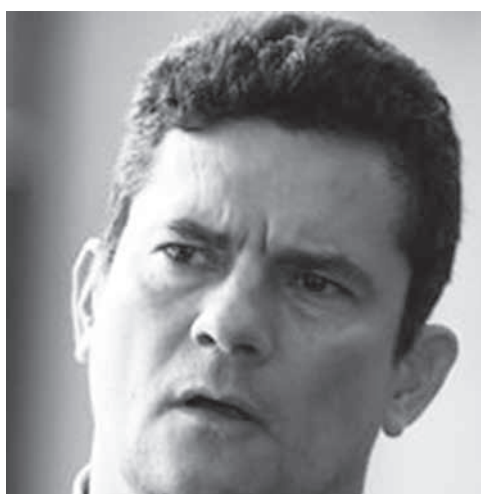
モロ法相

モロ法相は10日、マドリードの会談で「LJの作戦はナウスで行われたイベントで、暴露報道について尋ねられ、「刑事と検察の協力」を否定した」と述べた。司法と議会の反応は冷たく、両氏の解任を求めるなどの動きも出た。