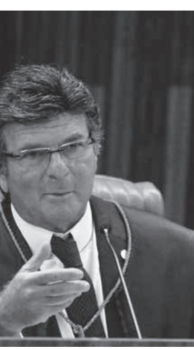
最高裁のフクス判事

また、インターセプトは午後9時48分、「9日に掲載した未編集版」として、モロ氏とダラグノル氏による会話の詳細を掲載した。