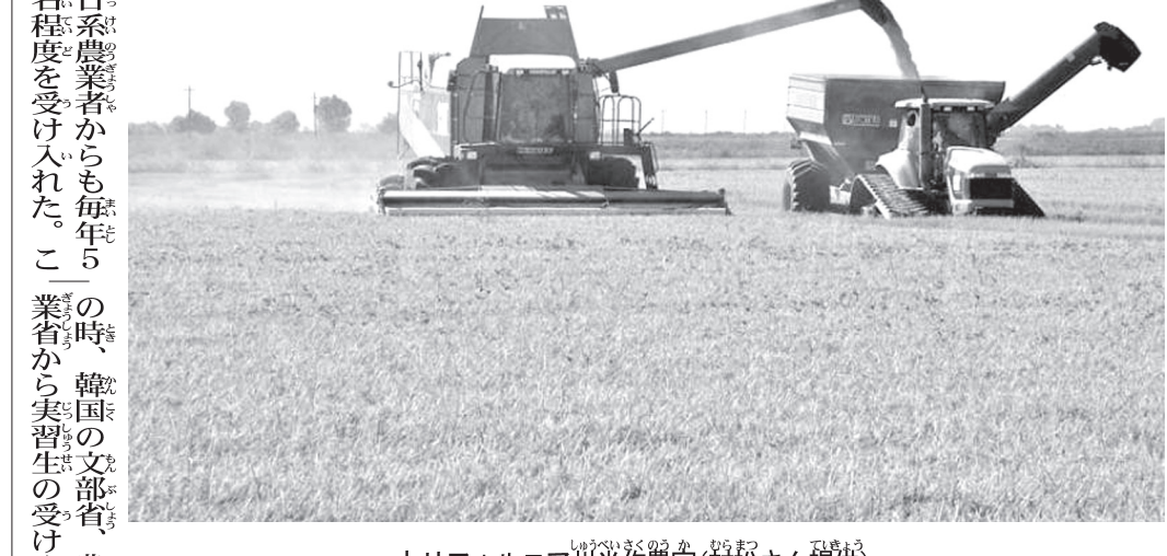
カリフォルニア州の農家

特別寄稿 島から大陸をめざして 第4号 5年後のカリフォルニア農業は、機械化とハイテクの導入で、さらに大きな進歩を遂げている。現地で育った実習生の受け入れを知ったブラジルのコチア農業組合と南信濃農業組合から、この事業に要請された。第1期生15名を受け入れた。ブラジルからの実習生は受け入れられ、農学部の学生として、農業の基礎知識を身に付け、実践的な技術を習得する。また、農業の発展に貢献するよう、指導員として来日している。この事業は、農業の国際化を促進し、農業従事者のスキルアップを図ることに貢献している。