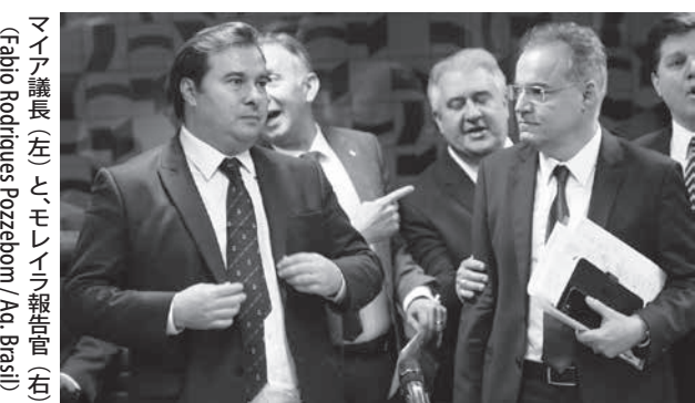
マイア議長(左)とモレイラ報告官(右)