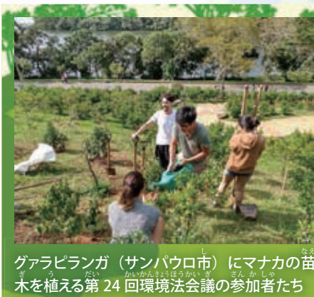
グアラピランガ(サンパウロ市)にマナカの苗木を植える第24回環境法会議の参加者たち

「スタッフの方は(聖地に関する)知識が豊富で、ただでなく、その真心と心遣いは大変素晴らしいものでした。また戻ってきたいですし、多くの