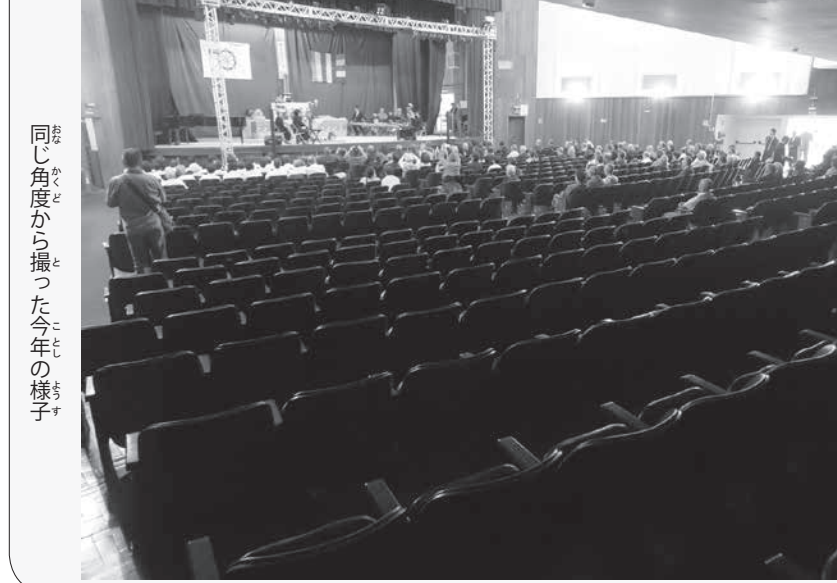
同じ角度から撮った今年の様子