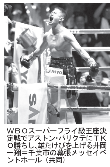
WB Oスーパーフライ級王者の井岡一翔(右)が、初防衛に成功して、初階級制覇を達成した。左は、同級王者の京口紘人(左)。