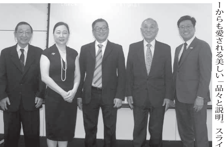
プレゼンを行った発表者ら

日本三大名産の那智の滝、美しい海岸で知られる白浜など自然あふれる観光地が多く存在する。醤油発祥の地として知られ、養殖鮪や高野豆腐、みかんや梅などの名産品も親しまれている。三重県のプレゼンターは、マリリン・モローから最近ではアンジェリーナ・ジョリーも好んで身に着けるなど、世界的スター