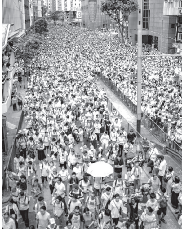
6月9日、逃亡犯条例改正案に反対するデモ (Hf9631, From Wikimedia Commons)

香港で、今度は200万人デモです。なぜ? 香港で6月9日、中国本土への容疑者引き渡しを可能にする「逃亡犯条例」改正案に反対する大規模デモが起りました。 あの時、その後どうなったのでしょうか? 動きを追ってみましょう。 まず、デモと警察の衝突がありました。 《「逃亡犯条例」改正案に反対する大規模デモ 警察と衝突も》6/10 (月) 14:16 配信 【6月10日 AFP】