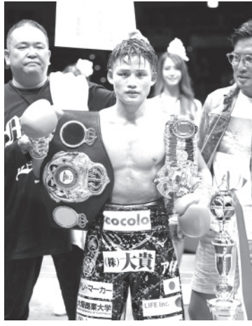
井岡一翔(右)が、初防衛に成功して、初階級制覇を達成した。左は、同級王者の京口紘人(左)。

【共同】ボクシングの世界戦各12回戦は19日、千葉市の幕張メッセイベントホールで行われ、世界ボクシング機構(WB O)スーパーフライ級王者の井岡一翔(右)が、初防衛に成功して、初階級制覇を達成した。左は、同級王者の京口紘人(左)。