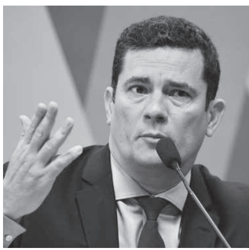
19日の上院でのモロ法相

上院CJでの質疑に先立ち、インタール13日に、モロ氏がJ捜査官デウソン・ダラグノル氏との会話の中で