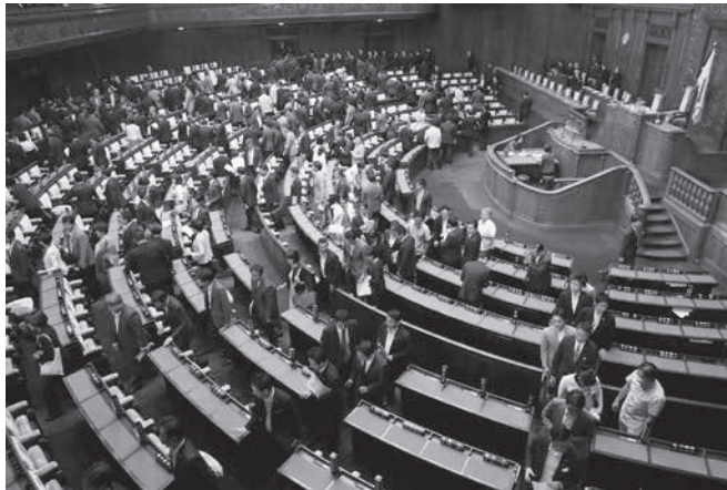
第198通常国会が閉幕、衆院本会議場を後にする議員。26日午後。

【共同】通常国会が26日閉幕し、与野党は第25回参院選に事実上突入した。政府は臨時閣議を開き、参院選を7月4日公示、21日投票とする日程を決めた。即日開票する。安倍晋三首相（自民党総裁）は「政治の安定」を訴え、憲法改正も掲げた。立憲民主党の枝野幸男代表は老後資金2千万円問題に端を発した年金制度不安を追及した。10月の消費税増税の是非も対立軸となり、与野党の論戦が激化する。選挙区と比例代表合わせて324人が立候補を予定する。