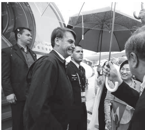
G20が開かれる大阪に到着したボウソナロ大統領

波紋は議会、最高裁にまで スペイン南部セビリアで、伯国空軍パイロットのマンエル・シウヴァ・ロドリゲス軍曹が25日に、39キログラムのコカインを所持していたとして逮捕された。26、27日付付字紙・サイトが報じている。