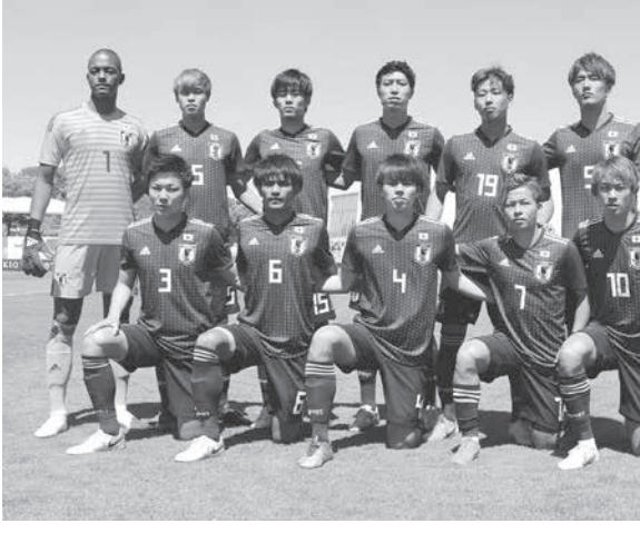
14回目の出場となる日本は、初の決勝進出だ

南仏で開催されている育成世代のサッカー国際大会、トゥーロン国際の準決勝が現地時間12日に行われ、日本と伯国がそれぞれ、メキシコとアイルランドに勝ち、15日の決勝に進出した。この大会には12チームが参加した。4チームずつ、3グループに分かれてリーグ戦を行い、各グループの1位、3チームと、2位の中で最も成績の良い1チーム、合計4チームが準決勝に進んだ。