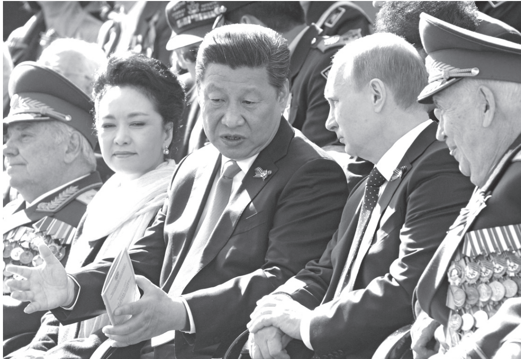
2015年、中国国家主席の習近平(左)とプーチン大統領(右)

首脳会談後、連携が最も進んでいるのがイラン問題だ。あえて米露の国際的信用を低下させるイラン対応 トランプの米露は、6月13日のオマーン湾での日本海軍のタンカーの爆破事件をイランが犯人だと無根拠に決めつけた後、6月20日に米海軍の無人偵察機を意図的にイランの領空に入れる飛ばし方をやり、イラン領空に入るときにトランスポンダを切つており、意図的な侵入だった。イランが正当防衛策として米偵察機を撃墜すると、米露は報復としてイランのミサイル基地などを空爆することを準備したが、実行予定の10分前にトランプが空爆を取りやめる決定を下した。 この一件は、国際社会における米露の信用失墜を加速することになる。欧州など、徳米は露米・反露の側に入った米露同盟国が「トランプの米露は信用できないので、ロシアや中国と協力して今回のイラン危機の真相究明(誰がタンカーを爆破したかなど)を行い、米露が悪い場合は、米露に毅然とした態度をとる必要がある」と考えるようになり、欧州と中露が共同で米露を批判するようになっていく。 トランプと中露は、意図的にこの流れを作つていると考