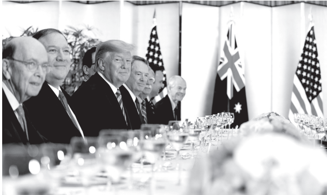
大阪G20に出席したトランプ大統領

で、米当局は決済を不許可にすることで経済制裁でき る。 イラン問題でドル決済から離脱する石油ガス取引 は、核兵器開発をしておらず核協定(JCPOA)を守っているのに米国から石油ガス輸出の不正行為を指摘し、イランがドル建てでない形で石油ガス輸出できるようにする対抗措置の実施を決めた。これも、中露が米露の覇権を押し始めた一例だ。 イランとのドル建てでない石油ガス取引について、トランプが核協定を離脱してイランを制裁し始めた後、EUがこのトランプの動きを不当とみなし、ユーロ建て(?)でイランと貿易できる特別な機構(SPV・INSTEX)を作つた。 だがトランプが「EUがSPVを稼働させるなら、米国はイランだけでなくEUの対米ドル決済も禁止する制裁をやるぞ」と脅したのでEUはSPVを延期・棚上げしている。ロシア政府は6月21日、EUがSPVを棚上げし続けるなら、ロシアがSPVに替わる非ドル的な決済機構を作り、それでイランと世界が取引できるようにするつもりだと発表した。ロシアは、すでに米国からドル決済を禁じられる制裁を受けており、イランを擁護しても追加の国家的な損失がない。 ロシア政府は、産油国であるロシアがイランの石油輸出を代行する(ロシアが代行輸出したと同量の石油をイランがロシアに輸出する)構想も発表している。 EUのSPVはユーロ建てのようだが(米国に制裁されたくないのにシステムが今ひとつ不明確)、ロシアは「主要通貨のバスケット建て」によるイランとの取引を構想している。 フェイスブックが暗号通貨で非ドル取引へ