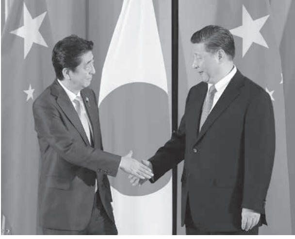
中国の習近平国家主席(右)と握手する安倍首相＝27日午後、大阪市内のホテル

【共同】安倍首相は27日、中国の習近平国家主席と大阪市で会談し、習氏が来春に国賓として日本を訪れる方針で一致した。首相が訪日要請し、習氏は応じる考えを示した。来年3〜4月が念頭にあり、両首脳は日中関係が一時の対立状態から「正常な軌道に戻った」と確認。28日開幕のG20大阪サミットと確認。成功へ連携を図る方針も申し合わせた。