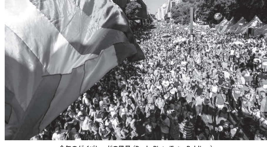
今年のゲイパレードの風景

23日、聖市最大の繁華街パウリスタ大通りで、毎年恒例のゲイパレードが行われ、主催者発表で300万人を集める盛況となった。