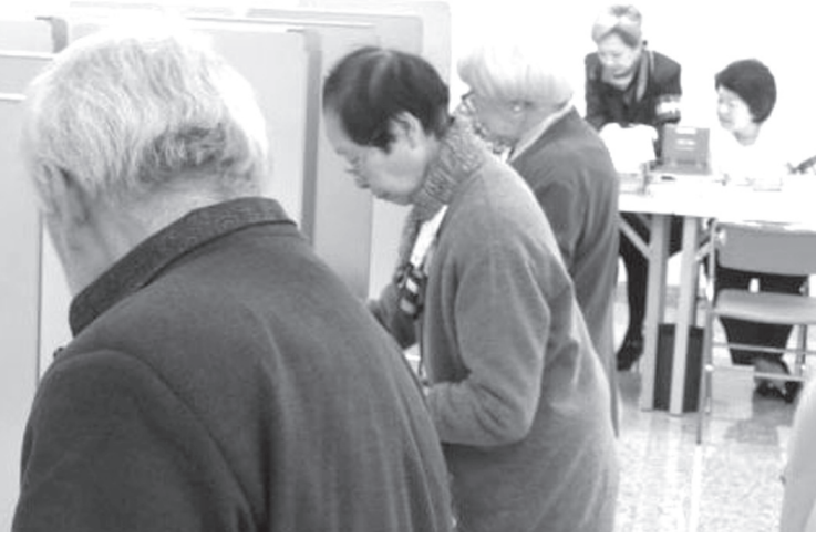
2016年の参議院選挙での在外投票の様子

2017年10月13日にサンパウロ日本国総領事館で第48回衆議院総選挙の在外投票を行った。その際に最高裁判所裁判官国民審査の投票を行うことができないことに気が付き、これは憲法に違反しているのではないかと考えた。