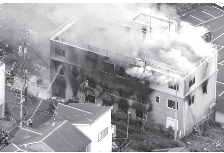
煙を上げるアニメ制作会社「京都アニメーション」のスタジオ＝18日午前11時36分、京都市伏見区

【共同】京都市伏見区のアニメ制作会社「京都アニメーション」第1スタジオで33人が死亡した放火火災で、3階と屋上に出る扉をつなぐ階段に死者が集中していたことが19日、京都府警や市消防局への取材で分かった。出火直後に消防隊員が現場に到着した際、扉は閉まった状態だったが、外からは開けることができた。炎や煙から逃れるため屋上に出ようとした人が殺されたが、何らかの理由で扉を開けられず脱出できなかった可能性がある。