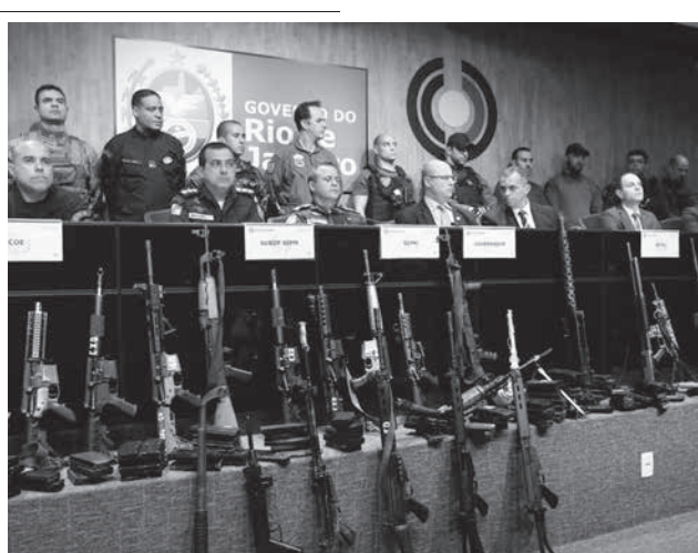
押収した武器などを前に作戦の成果を報告するリオ州知事ら

情報を得ていたと警察の補助として、大量の武器や麻薬を押収出来た。この結果に満足している。同知事によると、18日に摘発された武器は、国際的な犯罪組織の資金援助を得て調達されたもので、同市のフェウエイラを隠れ蓑にしたテロリスト達が利用していたと断