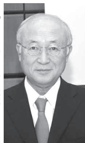
死去した天野之弥氏

【ワイルド共同】国際原子力機関(IAEA)は22日、天野之弥(あまの ゆきや)事務局長が18日に死去したと発表した。