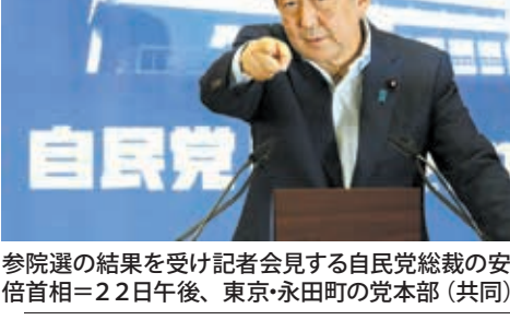
参院選の結果を受け記者会見する自民党総裁の安倍晋三首相。22日午後、東京・永田町の党本部

9条への自衛隊明記を含む自民党改憲案4項をめぐり、安倍政権は「改憲勢力」を確保し、国会での憲法議論の推進を自党に呼び掛けた。安倍政権下での憲法改正に前向きな「改憲勢力」が国会発議に必要な参院3分の2（164議席）を割り込んだことを踏まえ、「与野党の枠を超え、3分の2の賛同が得られる改正案を練り上げた」。自民党案だけにとらわれず、柔軟に議論して」と述べた。