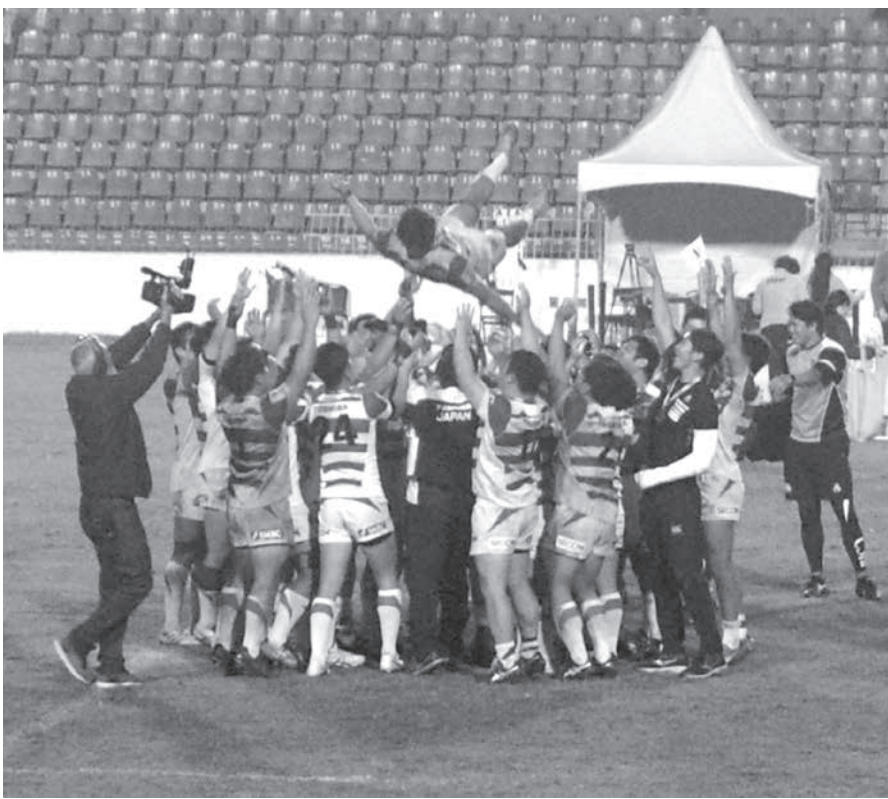
胴上げで優勝を祝う日本代表