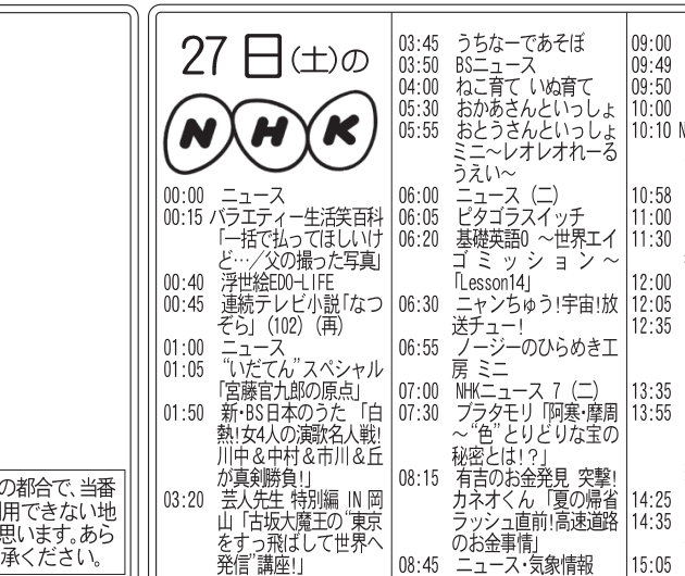
花の島での集合写真