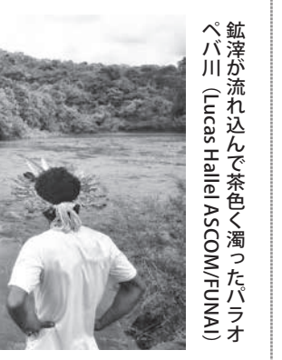
鉾澤が流れ込んで茶色く濁ったパラオペバ川