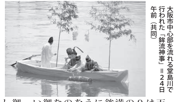
大阪市中心部を流れる堂島川で行われた「銚流神事」=24日午前

【共同】水都・大阪に夏本番を告げる大阪天神祭(大阪市北区)の天神祭が24日朝、市中心部を流れる堂島川での「銚流神事」で幕を開けた。川に船をこぎ出し、地