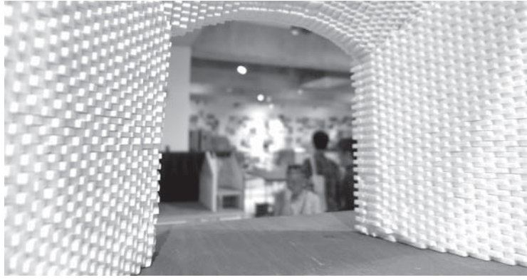
螺旋門のような模型から奥をのぞく