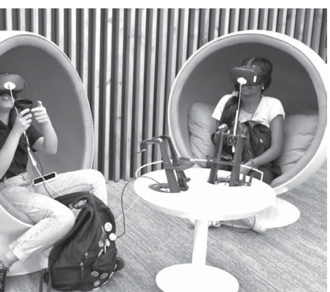
VR(仮想現実)体験で韓国旅行が可能