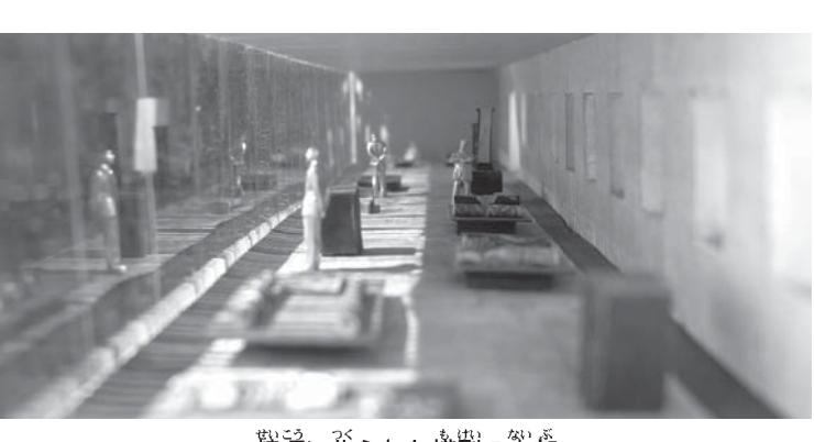
精巧に作られた模型の内部