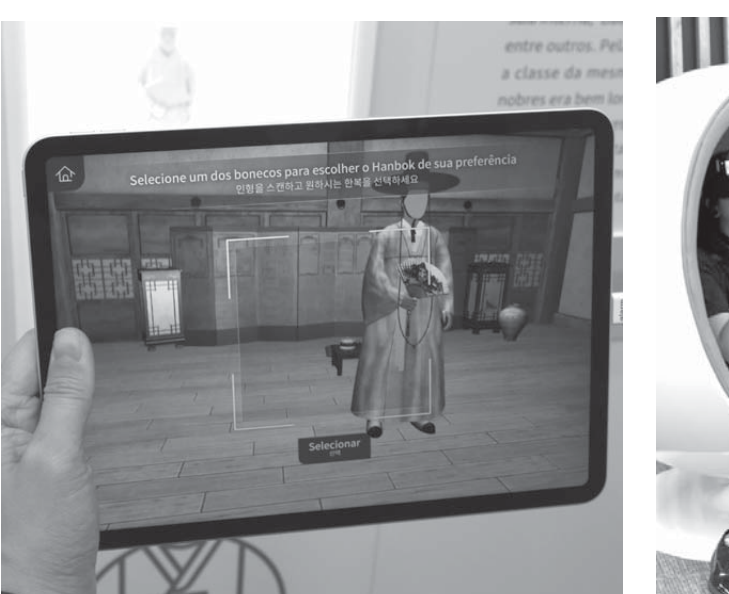
iPadを置物にかざすと映像が映し出される