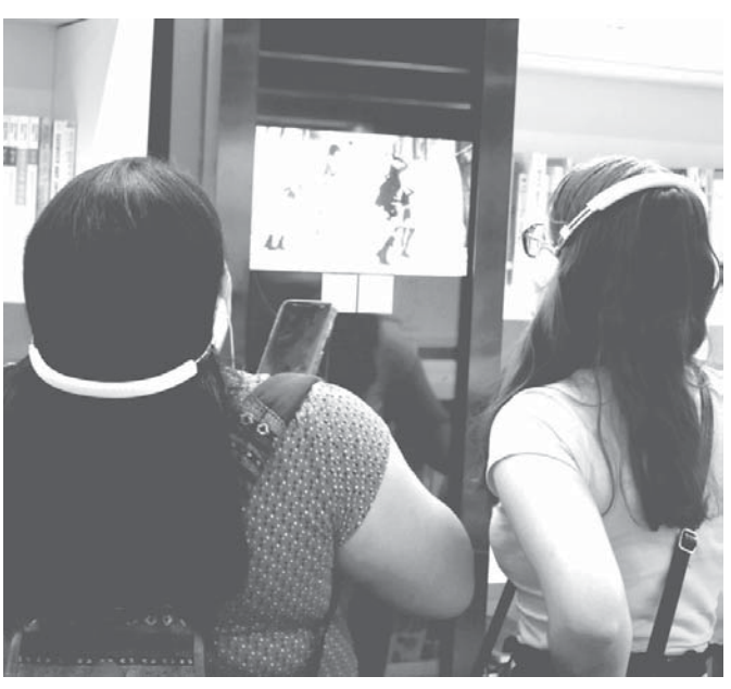
韓国映画の視聴も可能