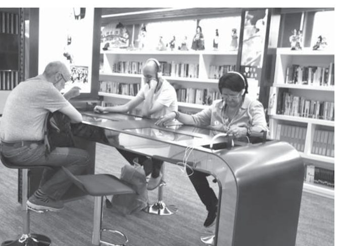
映像を見ながらK-POPを聴く来館者ら