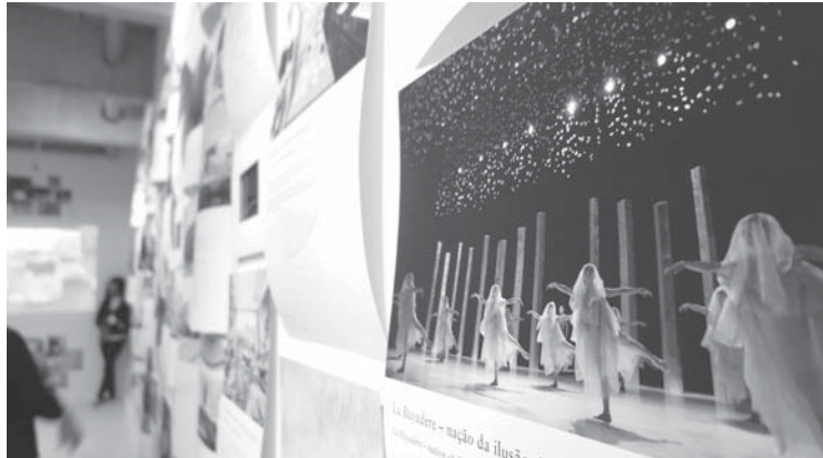
壁一面に貼られた作品の写真