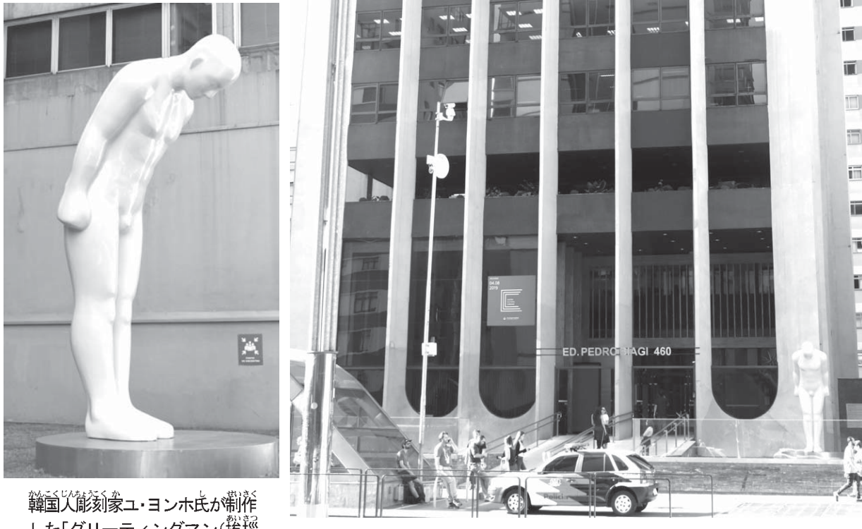
韓国人彫刻家ユ・ヨンホ氏が制作した「グリーティングマン(挨拶する人)」 メトロ・プリガデイロ駅上がってすぐの好立地にある韓国文化院