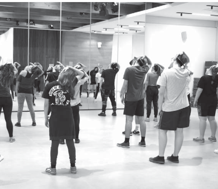
1階で行われるK-POP教室