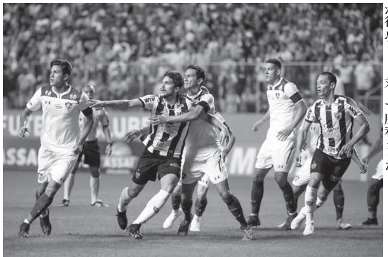
アトレチコ・ミネイロ対フルミネンセ戦

7連勝で首位を走るサントスFCをホームに迎えたアトレチコFCは、最近加入が発表されたダニエル・アウヴェス