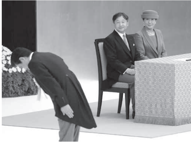
全国戦没者追悼式に出席された天皇、皇后両陛下。左は式辞を終え、一礼する安倍首相=15日午前、東京・日本武道館(共同)

【共同】終戦から74年を迎えた15日、政府主催の全国戦没者追悼式が東京都千代田区の日本武道館で開かれ、参列した遺族らは先の大戦で亡くなった約310万人を悼み、不戦の誓いを新たに誓った。令和初の追悼式。戦後世代の天皇陛下は「深い反省」という言葉を盛り込み、上皇さまの姿勢を継承された。安倍晋三首相は「歴史の教訓を深く胸に刻み」と述べたが、アジア諸国への加害責任には7年連続で触れなかった。戦争経験者が急速に減る中、記憶の風化が懸念される。