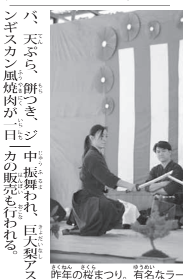
昨年(2018年)の桜まつり。有名なラーモス剣道部が演舞を披露する様子

色のコントラストを楽しむ。メインステージでは獅子舞、鬼剣舞、和太鼓、日本舞踊などを披露。そのほか、剣道や居合道、武術など武道の実演も行われる。落成される茶室では茶道の点前