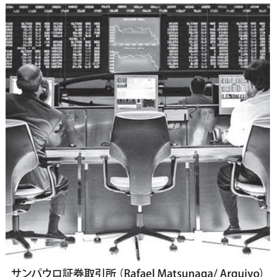
サンパウロ証券取引所

世界的な株値下落や景気後退への懸念の高まりが、石油や鉄鉱石といったコモディティ価格の下落や、外国投資の減少を招き、今年後半から来年にかけての伯国の経済活動に暗い影を落とすことは想像に難くない。