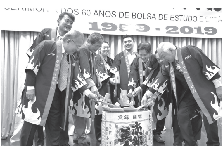
鏡割りを行った来賓ら