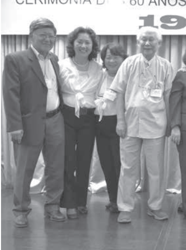
1976年の留学生からは、最も多い夫婦3組が誕生

移住地内には長崎県から「平和の灯火」を特別に移設した「平和の鐘公園」もあり、当日は見られることになっている。小林会長は、「これだけの白い花の桜が見られるのはラーモスだけなので、ぜひ足を運んで下さい」と来場を呼びかけた。問合せは電話(市役所)49-3257-000、Eメール(ラーモス文協)acbjapao@brasil.com、フェイスブック(parquesakura)まで。