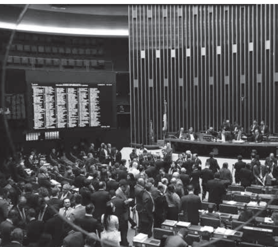
賛成多数で法案は下院で承認された

同法案では職権濫用罪、軍関係者と定められている。同法案は6月末に上院が適用される対象を、地方公務員、連邦レベルの公務員、検事、判事、金融活動管理審議会(Cofac)などの金融活動の監査・規制機関の職員のみとなった。