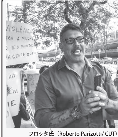
台風10号の影響で、高知県安芸市の漁港に打ち寄せた高波=15日午後4時6分

980ヘクトパスカル。中心の南東側600キロ以内は北西側500キロ以内は風速15メートル以上の強風域。