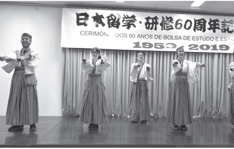
RYO高知よさこいによる開会のショー