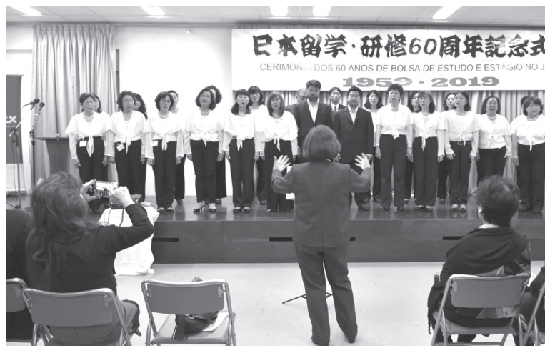
ASEBEXコーラスによる合唱の披露