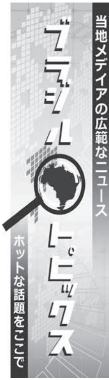
当地メディアの広範なニュース

年のリオ五輪で銅メダルを獲得。世界選手権でも、2014年、2017年の2回、金メダルを獲得し、終わったばかりのパンアメリカンでも金メダルを獲得した。また、セーリング女子49er FXのマルチネ・ダラエルとカエナ・クンゼのコンビも金メダルが有力視されている。昨年、世界選手権では4位に終わったが、世界ランク1位で、パンアメリカン大会でも優勝した。