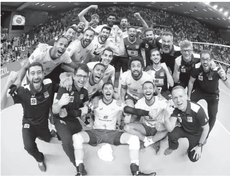
東京五輪出場権を得て喜ぶ男子バレーボール代表チーム

来月7月24日開幕の東京五輪まで、1年を切った。先日リマで終了したパンアメリカン大会で、メダル総数、金メダル数で自国史上最高記録を更新した伯国では、メディアが「東京五輪メダル候補40人」のリストを発表した。ここでは「金メダル候補筆頭」を中心に紹介する。