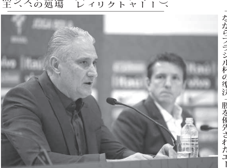
16日のチッチ代表監督

ブラジル・サッカー連盟は16日、9月に行われる親善試合のため、本代表と五輪代表(22歳以下)の二つの代表の選手を一挙に発表した。まず、本代表は以下の通り。 (キーパー) エデルソン(マンチェスター・シティ)、ウエーウエルソン(パルメイラス)、ヴァン(ポンテ・プレッタ)、(ディフェンダー) ダニエル・アウヴェス(サンパウロ)、ファギネル (コリンチャンス)、アパケタ(ACミラン)、(フオワード) ネイマール(PSG)、フィルミノー(リヴァプール)、リシャールソン(エヴァートン)、ネルス(アヤックス)、ブルーノ・エンリケ(フラメンゴ)、ヴィケ(フラメンゴ)、アル・マドリッド、コバ・アメリカの退場で2カ月間の出場停止処分を受けたフオワードガブリエル・ジェズス、故障の守護神アリソン、コバ・アメリカの得点主