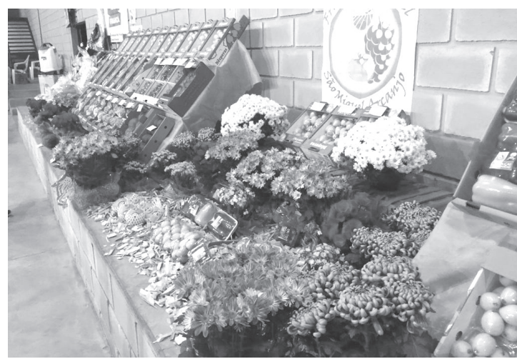
販売された新鮮な果物

聖州サンジェルアルカンジョ市のピニヤールビニヤール文化体育協会(西川修治会長)は、第7回びわ祭りを10、11両日、同会館で開催した。10日夜には在聖日本国総領事の野口泰三氏も来場。寒さや父の日が重なったこともあり、昨年に比べ客足は鈍ったものの、新鮮な果物が販売された。 だが会場では、今が旬の特産品に加え、デコポン、アテモイアなどの新鮮な農産物を販売。ラーメン、手巻き寿司、たこ焼きなど日本食の店も並び、同地和太鼓チーム「飛騨太鼓」やよさこい、百人歌手によるショーに、来場者は大いに楽しんだ。