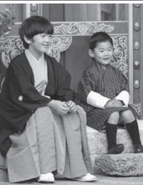
プータンのティンブーで、ジグミ・ナムゲル王子と写真に納まる秋篠宮家の長男悠仁さま=19日

【共同】米国の中国製品に対する第4弾の追加関税発動を控え、日本企業が影響を避けるために生産拠点を中国の外へ移す動きが加速してきている。米中の対立は「新冷戦」と呼ばれるほど深刻化し、解決の糸口が見えない。両大国に挟まれた日本企業はサプライチェーン(部品調達の供給網)の大幅な見直しを迫られている。米国はこれまで年間約2500億ドル(約2兆6500億円)相当の中国製品に対して追加関税を発動済み。第4弾では残るほぼ全ての中国からの輸入品が対象となり、9月1日に発動する。スマートフォンやゲーム機など一部品目の発動は12月15日に延期する見通しだ。大手商社幹部は「春ごろまでは貿易摩擦が近く取束するとの期待もあつたが、もう限界だ。対立長期化に備え、中国で投資する生産拠点を大幅に見直すを得ない」と話した。