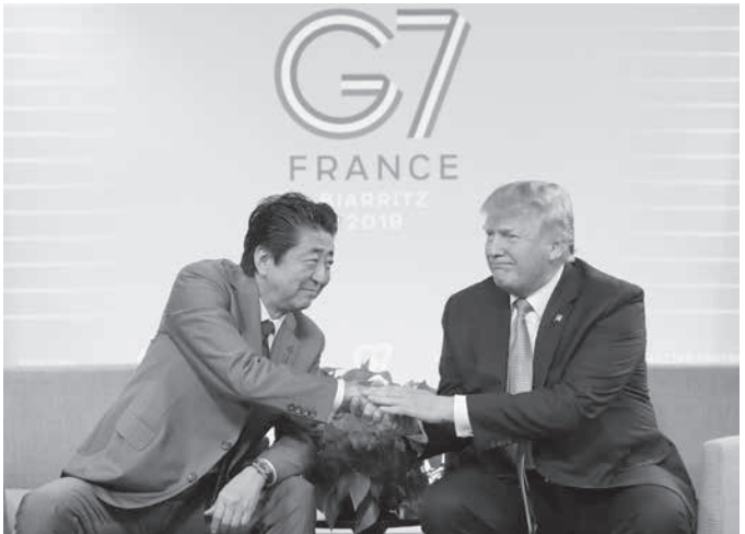
日韓軍事情報包括保護協定の破棄決定の通告を受け、厳しい表情で韓国外務省を出る長嶺安政駐韓大使=23日、ソウル

【ワシントン共同】安倍晋三首相とトランプ米大統領は25日、フランス南西部ビアリッツでの日米首脳会談後に開いた共同記者発表で、日米貿易交渉が大枠で合意し、9月の国連総会に合わせて開く首脳会談で貿易協定の署名を目指す意向を示した。首相は民間企業を通じて米産トウモロコシを購入する方針も表明。米農家は対中貿易摩擦で中国への輸出が伸び悩んでおり、トランプ氏が要請した。