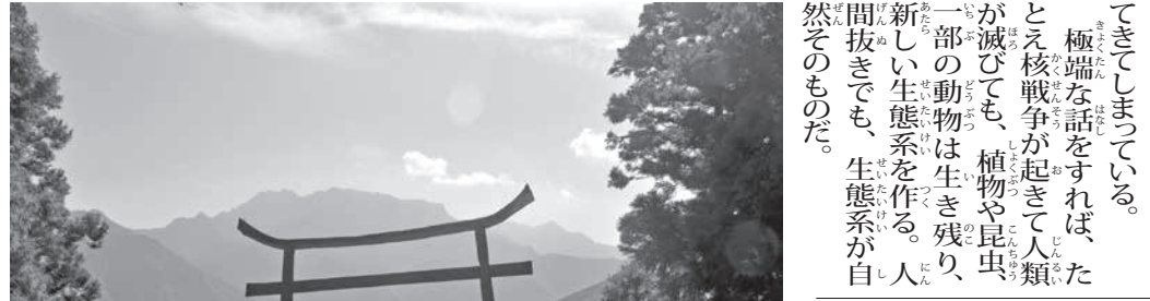
自然崇拝の地。日本で修験道の聖地とされる星ヶ森の石鏡山(愛媛県)の遙拝所 (Reggaeman)

「アマゾン火災で舞い上がった煙の微小粒子の増加が、実は18日(日)から聖市でも観測されていたとの記事も読み、事態の深刻さを痛感した。たしかに先週のはじめ聖市でも午後6時なのに、まるで夕方6時のような異様な暗さになった日があった。」