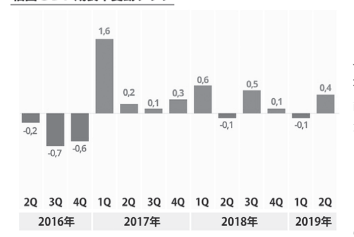
伯国GDP成長率変動グラフ