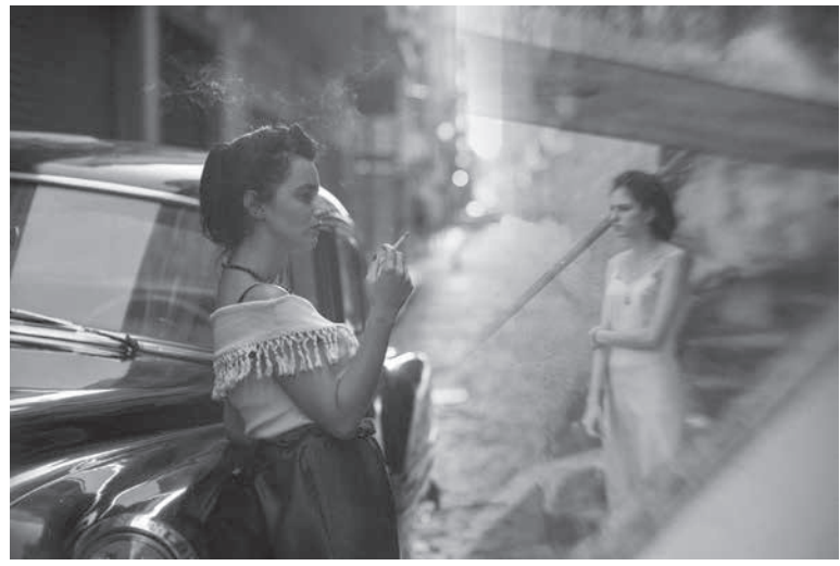
ア・ヴィダ・インヴィジブルの一幕

《アカデミー賞》 来月2月に行われるアカデミー賞の国際映画賞への伯国からの出展作品として、カリム・ア・イヌス監督の「ア・ヴィダ・インヴィジブル」が27日に選ばれた。