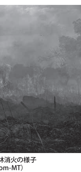
マツト・グロソ州での森林消火の様子

連邦政府によると、この大統領令は例外的かつ一時的なもので、環境を守るために行うという。なお、今回の大統領令では、「環境機関が植物の開発要領などの具体的な目標を記した」という。また、金採取人(ガリンペイロ)による鉱物採掘に関する規定を、対策集に盛り込むことも考えているという。 また、今週に入ってから、アマゾン州の森林火災防止対策が各地からあがりはじめています。