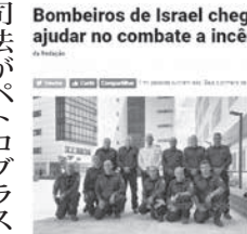
Bombeiros de Israel chegam a ajudar no combate a incêndios

軍や国内の消防士も現地に、アマゾン火災の撲滅を支援し、森林火災の撲滅を打ち出した。アマゾン火災の撲滅を打ち出した。アマゾン火災の撲滅を打ち出した。