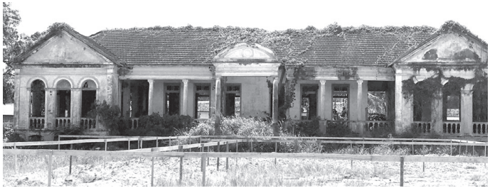
かつて臨時休養所にもなった橋爪会館跡地

入植当初からマラリアなど風土病に悩まされたトメアスーの歴史は、病院なしには語れない。