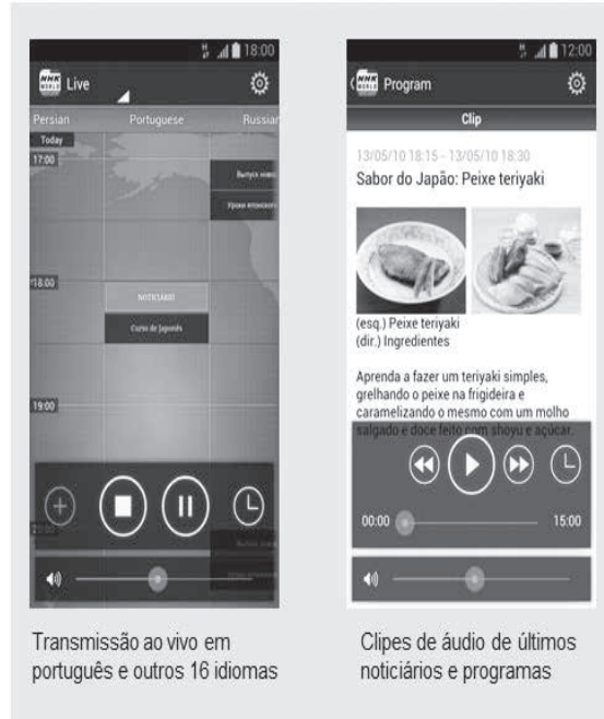
Transmissão ao vivo em português e outros 16 idiomas