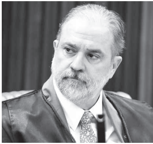
アラス氏

今回のアラス氏指名は、任期は2年にトリプリセを無視して選ばれたが、16年ぶり(長官)は、全国判事協会(ANPR)も「検察庁の意向が反映されなかった」として抗議している。