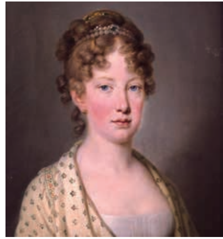
マリア・レオポルジーナ・テ・オーストリア皇后 (Joseph Kreutzinger [Public domain])

ナポレオン軍のリスボン侵攻直前の1807年11月、ポルトガル王家が乗った艦隊はイギリス艦隊に護られてブラジルへ避難。翌年08年3月にポルトガル領植民地の中で一番裕福だったブラジルの主都リオに移った。この時ブラジルに上陸して最初に君臨したポルトガル王族は女王マリア1世だった。王を戴いた「ブラジル植民地」は1815年から正式に「王国」へと格上げされた。