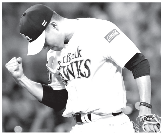
プロ野球ロッテ戦でノーヒットノーランを達成し、拳を握りしめるソフトバンクの千賀晃大投手。育成ドラフト出身選手としては初の快挙となった=6日、ヤフオクドーム