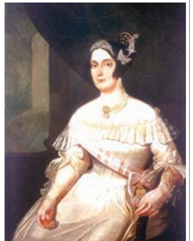
サントス侯爵夫人ドミチーリア (Francisco Pedro do Amaral [Public domain])

ペドロの性格を支配していたのは、過剰とも言える力強い情動だったと言われる。ウィキペディアには「彼は時々、変装してリオの悪所に通った。彼が酒を飲むのはよくない女たちらしき人々を伴って、関係を持った女性は、フランス人ダンサーのノエミ・ティアリイなどいい、彼女は彼の子を産んだ」とある。ジョアン6世は息子の将来を心配して、オーストリア皇帝の皇女マリア・レオポルジーナと結婚させた。1817年にペドロはレオポルジーナと結婚した。