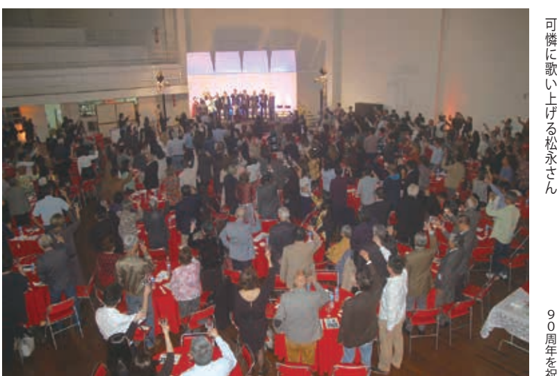
盛大に行われたダイナーショー