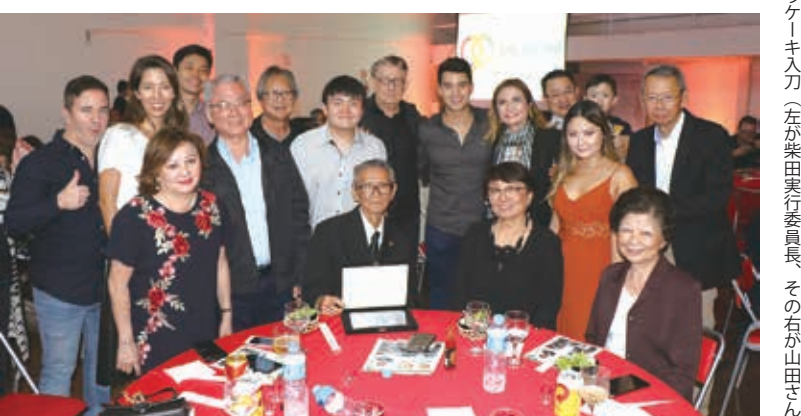
山田さんと親族ら