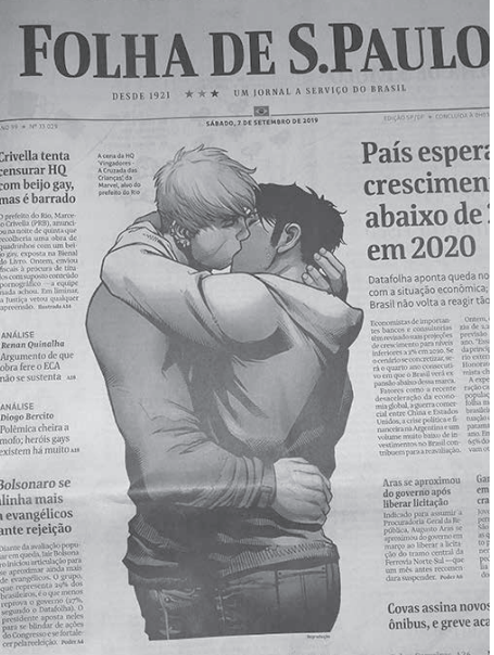
「リオ市長の検閲行為」と大きく報じる7日付けフオリヤ紙一面

連書籍の買占め及び無料配布へと発展した。7日、9日付けの各紙サイエントが報じている。