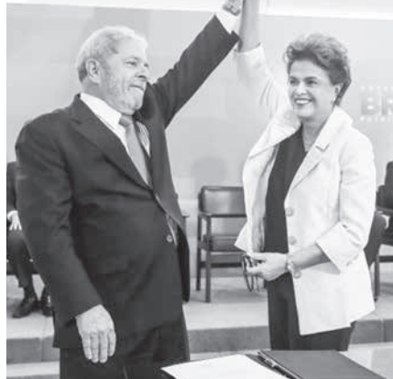
16年3月16日のルーラ氏とジウマ氏