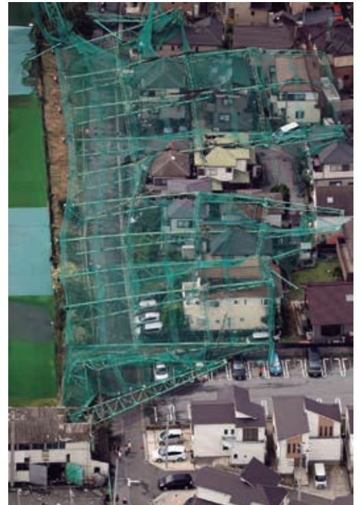
台風15号の影響でネットごと倒壊したゴルフ練習場のポール。住宅を直撃した=9日午前、千葉県市原市

【共同】首都圏は9日、台風15号が直撃し、JR東日本の在来線は始発から「計画運休」となるなど交通機関が乱れ、約277万人に影響した。被害も相次ぎ、強風にあおられたとみられる女性ら3人が死亡し、各地で60人以上が負傷。千葉県の海水浴場では1人が行方不明となった。送電線の鉄塔が倒壊するなどして約93万軒が停電したほか、ゴルフ練習場のポールも倒れて住宅を破損。茨城県にある日本原子力研究開発機構では冷却塔が倒れ、東京湾では多くの船舶が漂流した。