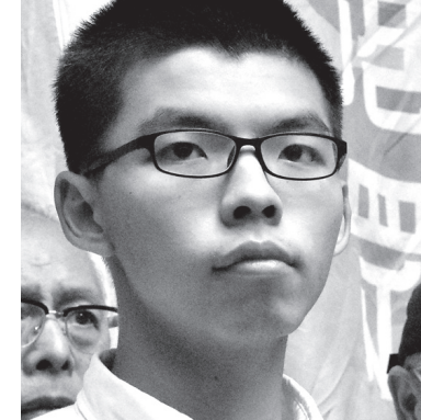
香港の民主化団体「学民思潮」の元リーダー黄之鋒(ジョシュア・ウォン)

「香港行政長官選挙の不正を撤回せよ」という要求が5つに増え、5つの要求とは？？？