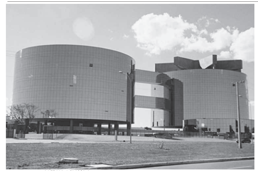
連邦検察庁特捜局

「R」サイトにある説明文(www.aupr.org.br/istatistic)によれば、実は内部選挙によるリスト作成はFHC時代の2001年に始まっている。01年にプリンデイロ氏は7位にすぎなかった。FHCは選んだ。今回のボウソナロには先例があった。 ルルー大統領は03年、選挙戦のライバルだったFHCを嫌う官僚側から提案だからと好感し、初めてそれに応じた。そこから世界にも珍しい「選挙で選ばれた連邦検察庁長官」という制度が始まった。 ボウソナロ大