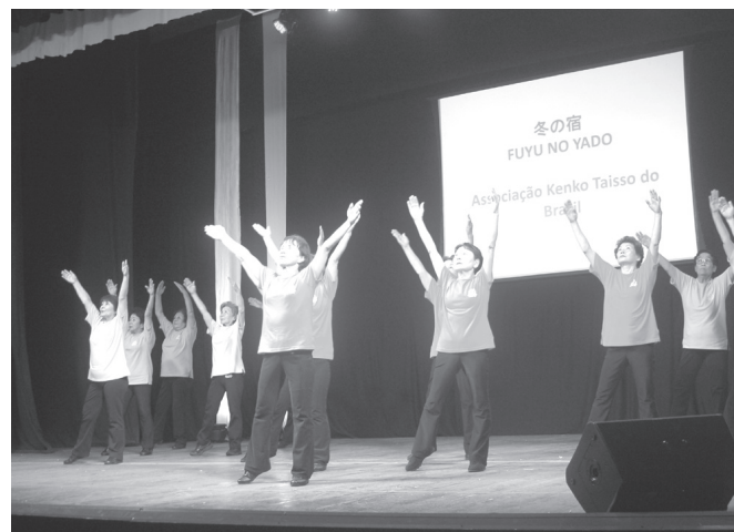
ブラジル健康体操協会のステージ