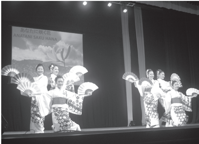
遠方からリンス本願寺アソカ学園生徒の特別出演も