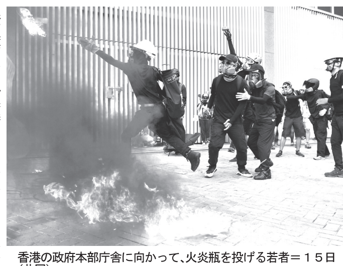
香港の政府本部庁舎に向かって、火炎瓶を投げる若者=15日

「自由が主、平等は従」という考えを持っている。自由は、自由が主、平等は従、という考えを持っている。