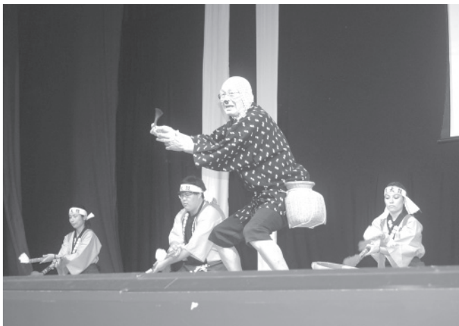
笑いを誘った鳥根県人会の郷土芸能ショー