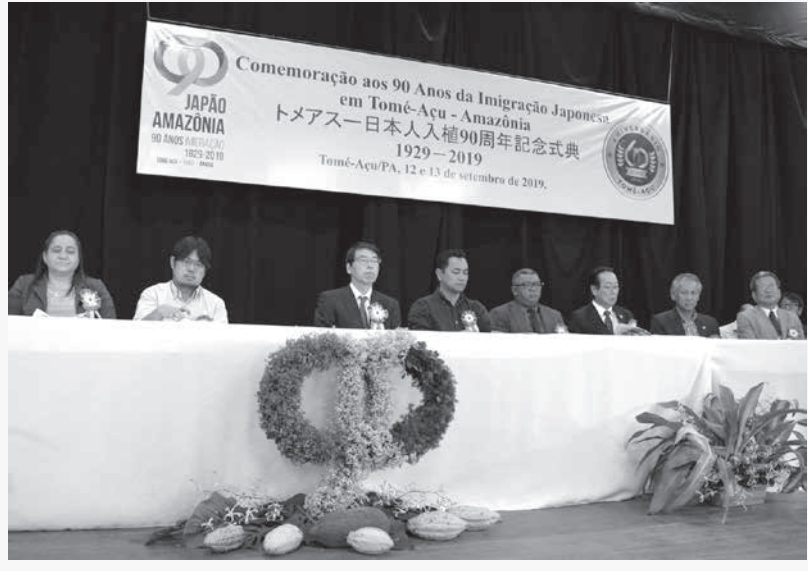
13日、ブラジル北部トメアスで開かれた日本人のアマゾン移住90周年記念式典(共同)

トメアスの移住者らは50年代にコショウ生産で成功したが、病害などで作物の多角化を模索。カカオや熱帯果樹などを混植する「アグロフォレストリー」を確立し、国内外で評価されてきた。