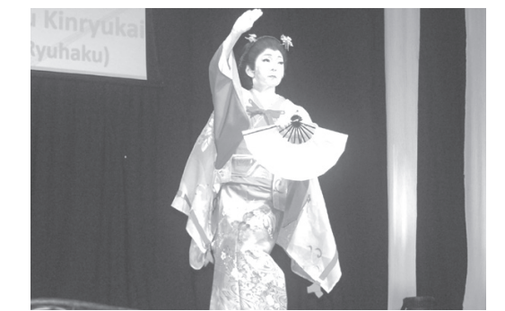
花柳金龍会の華やかな舞い