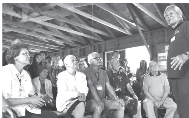
第2次大戦中に日系米国人を収容したハートマウンテン強制収容所跡地に再現された居住棟で、当時の生活ぶりを語る元収容者の男性(手前右)=7月、米西部ワイオミング州(共同)

【コディ共同】第2次大戦中、敵性外国人として強制収容された日系米国人が、トランプ政権の移民政策に異議を唱えている。かつての日系人収容所に中南米系の不法移民の子を隔離する計画が浮上り、自分たちの歴史と重ね合わせた日系人らが抗議活動を起こした。