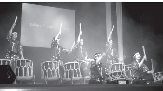
桜吹雪和太鼓の方強い演奏