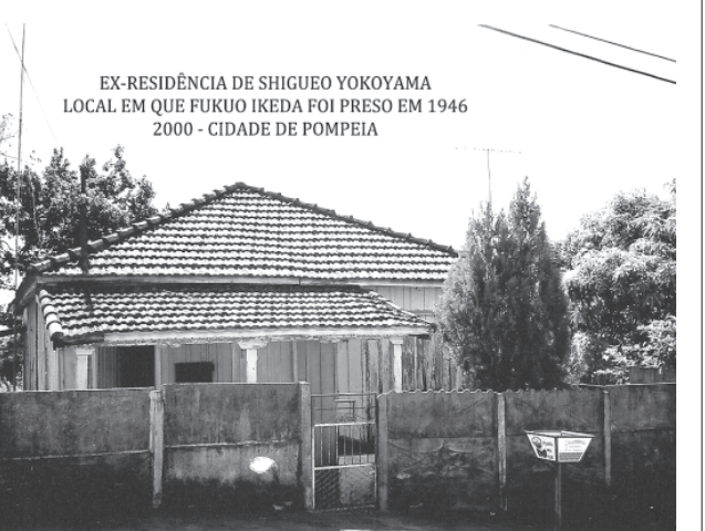
ポンペイアの自宅