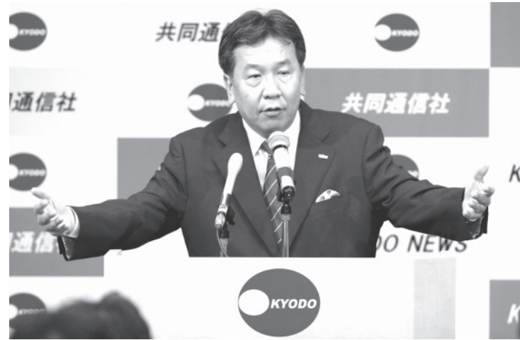
共同通信社編集局長会議で講演する立憲民主党の枝野幸男代表（1日午後、東京都港区）