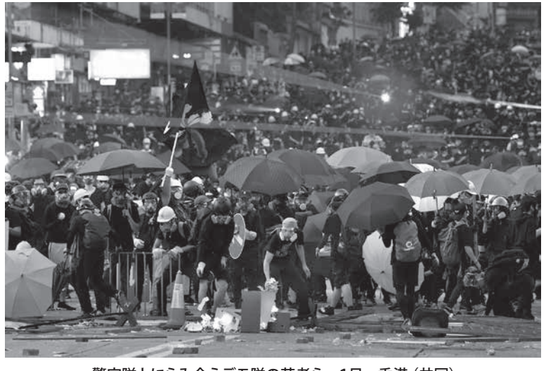
警官隊とにらみ合うデモ隊の若者ら=1日、香港

【香港、北京共同】中国建国から70年を迎えた1日、香港で数万人の市民らが無許可のデモを 執行。若者らと警官隊が各地で激しく衝突した。香港警察などによると、警官が九龍半島の衝突で 実弾を発砲、高校2年の男子生徒(18)が左胸を撃たれて重体となった。「逃亡犯条例」改正案を 巡る一連のデモで実弾発砲による負傷者は初めて。警察は各地で催涙弾を発射、多数を拘束した。