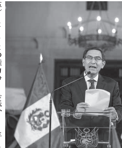
議会閉鎖を発表するヴィスカラ大統領

だが、18年3月、クチンスキー氏がオデブレイトからの取柄疑惑で罷免審理にかけられ、自ら辞任。後任に副大統領で政界無所属のヴィスカラ氏が昇格した。