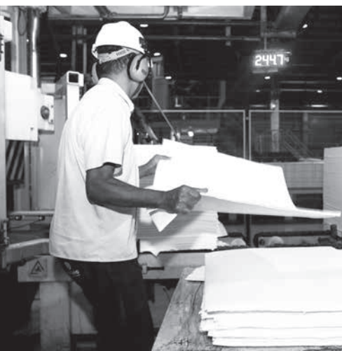
北東伯パイア州の製紙工場 (参考画像・Amanda Oliveira / GovBA)

専門家たちは、伯国工業低迷の理由として、「昨年5月に発生した2015〜16年の景気大規模トラスクト」や「内需の低迷」などを挙げており、「今年1月にミナス州で発生したブルマ