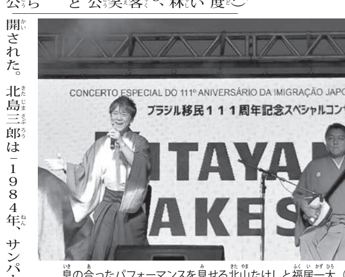
北山たけしと福居一大

日本のNHK紅白歌合戦にも出場した人気歌手・北山たけしの伯楽公演「北山たけし・アサイ」が9月29日、サンパウロ市のアサイ文化協会館で行われた。人口約1万5千人の小さな町に、約350人が詰めかけた。会場は大いに盛り上がった。