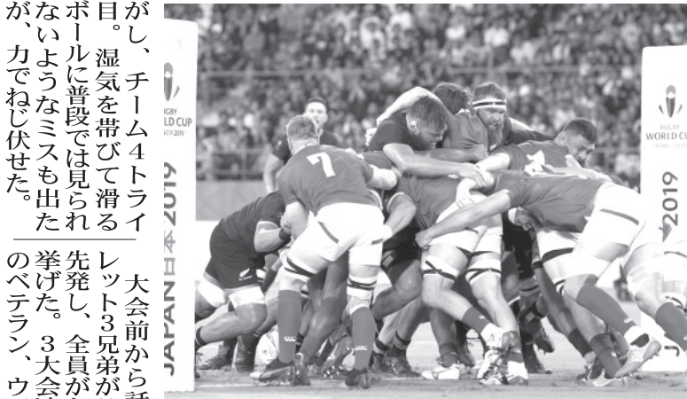
ラグビーワールドカップ(W杯)日本大会第11日(2日)は、大分県大分市で、大分県立大分大学ラグビー部(以下「大分大」)と、ニュージーランド代表との試合が行われ、大分大が2対0で勝利した。

【共同】ラグビーワールドカップ(W杯)日本大会第11日(2日)は、大分県大分市で、大分県立大分大学ラグビー部(以下「大分大」)と、ニュージーランド代表との試合が行われ、大分大が2対0で勝利した。 【共同】ラグビーワールドカップ(W杯)日本大会第11日(2日)は、大分県大分市で、大分県立大分大学ラグビー部(以下「大分大」)と、ニュージーランド代表との試合が行われ、大分大が2対0で勝利した。