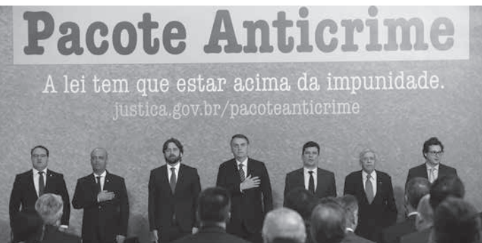
ボウソナロ大統領 (中央) ホウソナロ大統領 (中央)

連邦政府は3日、犯罪防止法案 (Pacote Anticrime) 成立機運を高めるためのキャンペーンを開始した。3、4日付付字各紙・サイトに報告した。 ボウソナロ大統領 (社 当選後、人気判事だった) セルジオ・モロ氏を法務大臣に抜擢。モロ氏が中心となつて立案した犯罪防止法は2月に議会に提出されたが、社会保障制度改革の審議が優先されてきたこともあり、犯罪防止法案は採決の目処が立っていない。議会は甘んじ、汚職に甘い職権乱用防止法を通し、来年の地方選挙のルールを定めた法案でも汚職に甘い項目を承認した。 政府はそんな状況を変えるため、1千万レアルを投じて犯罪防止法案のPRを始め、大臣に抜擢されたモロ氏が中心となつて立案した犯罪防止法は2月に議会に提出されたが、社会保障制度改革の審議が優先されてきたこともあり、犯罪防止法案は採決の目処が立っていない。議会は甘んじ、汚職に甘い職権乱用防止法を通し、来年の地方選挙のルールを定めた法案でも汚職に甘い項目を承認した。 政府はそんな状況を変えるため、1千万レアルを投じて犯罪防止法案のPRを始め、大臣に抜擢されたモロ氏が中心となつて立案した犯罪防止法は2月に議会に提出されたが、社会保障制度改革の審議が優先されてきたこともあり、犯罪防止法案は採決の目処が立っていない。議会は甘んじ、汚職に甘い職権乱用防止法を通し、来年の地方選挙のルールを定めた法案でも汚職に甘い項目を承認した。