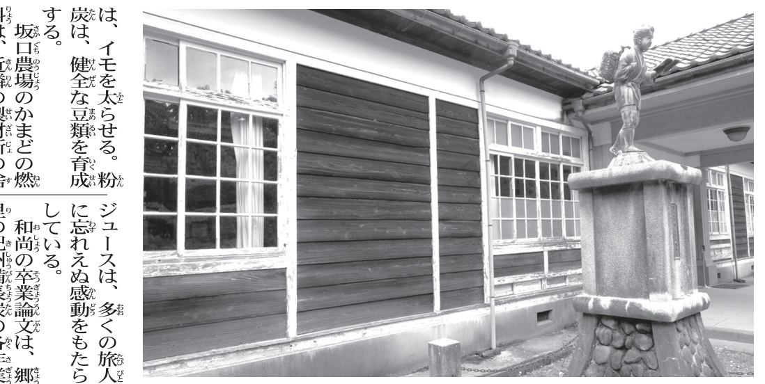
南足柄にある丸太の森、福沢小学校(昭和8年に建設された木造校舎)