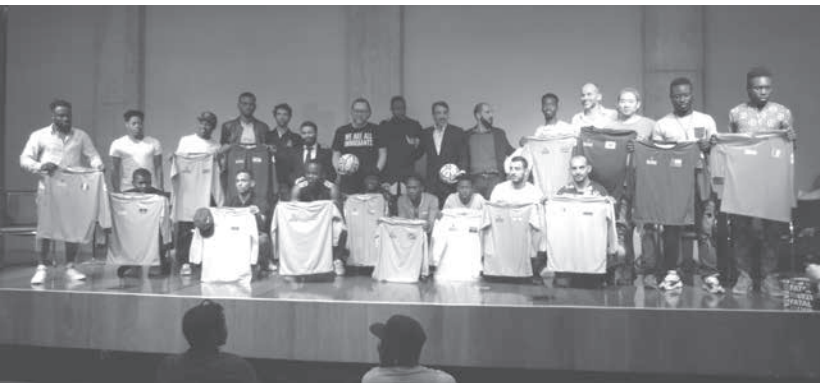
『第6回難民と移民のW杯』サンパウロ大会の開幕式で、主催、後援の代表らとユニフォームを受け取った16カ国チームのキャプテン (Foto e Texto: OURA Tomoko)

NGOアフリカ・ド・コラソン主催、国連難民高等弁務官事務所 (UNHCR)、国際移住機関 (IOM)、サンパウロ市及び数社の民間企業が後援する『第6回難民と移民のサッカーW杯』サンパウロ大会の開幕式が4日、聖市パカエンブー競技場の講堂で行われた。