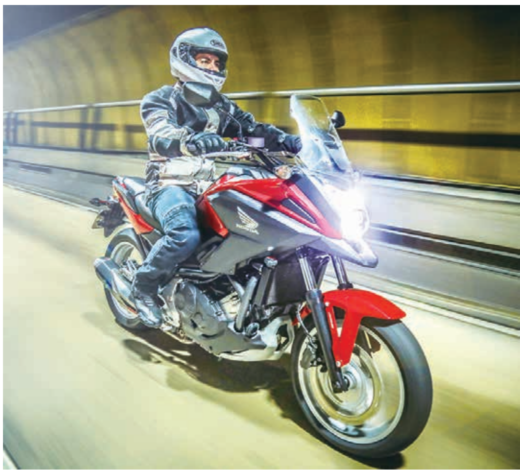
A NC 750X caracteriza-se pelo conforto, versatilidade e capacidade de carga.

Conhecida pela sua versatilidade, potência e economia de combustível ganhou três novas opções de cores: azul perolizado, vermelho perolizado e verde fosco. Preço: R$ 33.980,00 (valor como base Estado de São Paulo)