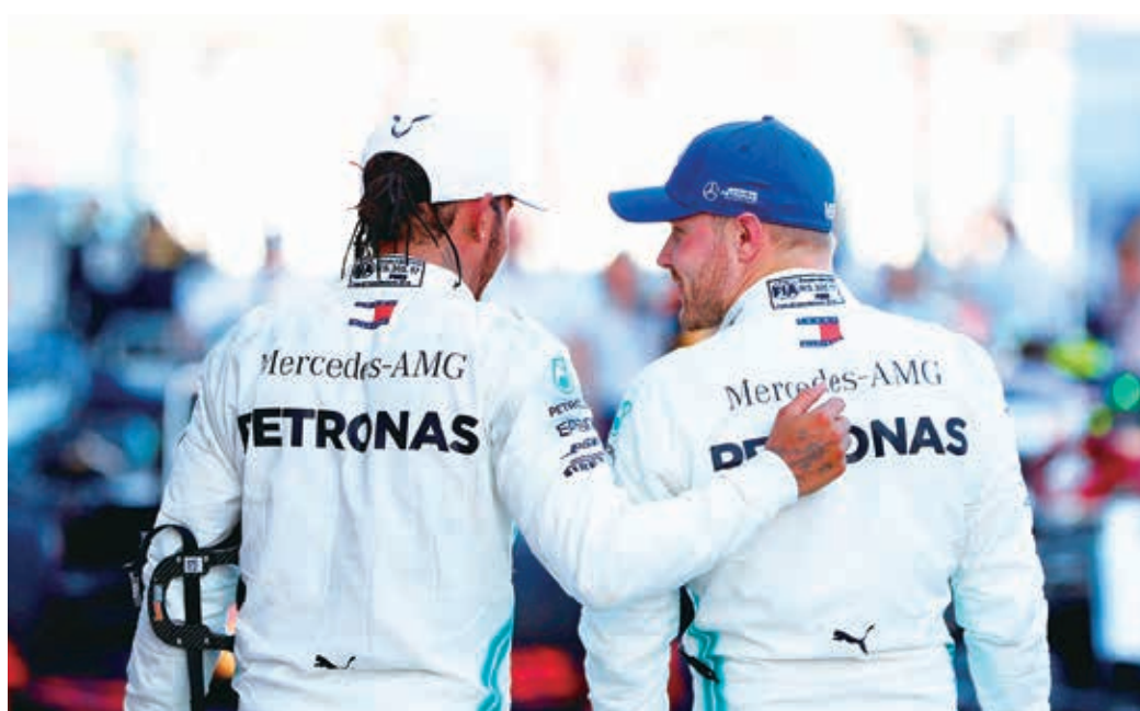
Lewis Hamilton e Valtteri Bottas lideram o Campeonato Mundial de Pilotos da F-1.

As Ferraris largaram na frente, mas a entrada de um safety car beneficiou Lewis Hamilton da Mercedes.