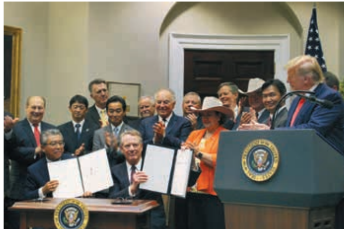
日米貿易協定の署名式に出席した（手前左から）杉山晋輔駐米大使、ライトハイザー通商代表、トランプ大統領＝7日、ホワイトハウス

【ワシントン共同】藤原章博 日米両政府は7日、米ホワイトハウスで貿易協定に署名した。米農産物関税を環太平洋連携協定（TPP）水準に引き下げる。安倍晋三首相は8日、参院本会議で「わが国の幅広い工業品で、米国の関税削減撤廃が実現する。農家の皆さんの不安に對しても、万全の対策を講じる」と述べた。7日の署名式に出席したトランプ米大統領は「日米双方にとつて大きな成功だ」と自賛した。協定は来年1月1日にも発効する見通しだ。