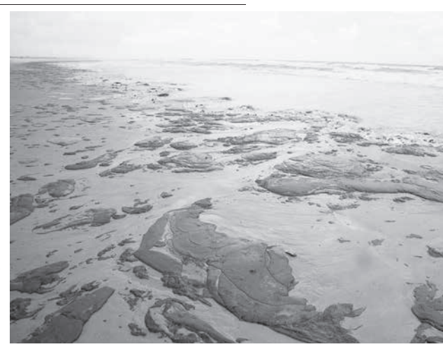
セルジッペ州の海岸に漂着した原油

ウミガメの子放流も当面中止 だが、同大統領は8日朝、リカルド・サレス環境相との会談後、「北東部の海岸に漂着した原油は意図的には撒かれた可能性はある」と発言。環境相は7日、北東部の海岸を歩き、上空視察も行って来たばかりだ。 ボウソナロ大統領は5日、連警と海軍、Ibama、生物多様性保全のためにシコ・メンデス