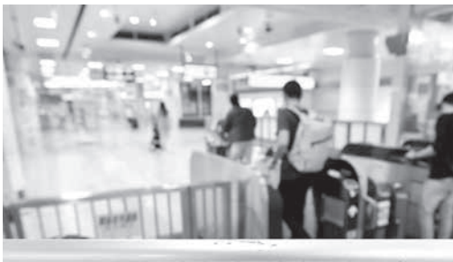
台風接近に伴い、列車の運休が発生する場合があります。最新の運行情報は下記ホームページをご確認ください。 http://traininfo.jreast.co.jp/traininfo/service.aspx (JR東日本 運行情報) (共同)

【アクチャカレ(トルコ南東部)共同】吉田昌樹「重苦しく響く砲撃音、黒煙に覆われるシリアの空」。シリア北部一帯で、激化するトルコ軍の侵攻にシリア側は反撃を受けて緊張が包み込まれている。シリア側では悲痛な声。「攻撃をやめて」「どこに行けばいいのかわからない」。戦間から逃れたクルド人住民らは「侵攻を黙認した米国の裏切り」を非難した。 トルコ軍は11日までに、シリア北部の村々を制圧。トルコ軍は11日までに、シリア北部の村々を制圧。トルコ軍は11日までに、シリア北部の村々を制圧。