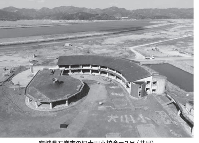
宮城県石巻市の旧大川小校舎=2月

【共同】東日本大震災の津波で犠牲になった宮城県石巻市立大川小の児童23人の遺族が、市と県に約23億円の損害賠償を求めた訴訟で、最高裁判事1小法廷(山口厚裁判長)は11日までに、市と県の原告を退ける決定をした。10日付、事前の防災体制の不備により、児童を安全な高台に避難させることができなかった過失を認め、計約14億3600万円の支払いを命じた二審仙台高裁判決が確定した。