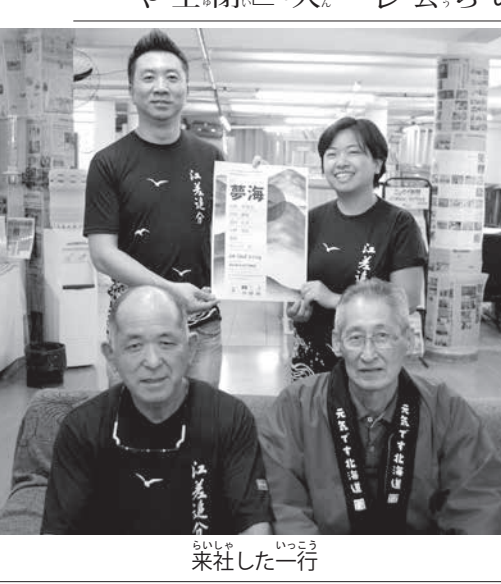
一行が来伯した一行

「日系資料館連絡協議会」の設立が提呈され、聖市のブラジル日本移民史料館で来年シンポジウムを開催することになった。最終日は在日日系人スピーチ「10年後の私」と大会宣言を発表して閉会し、衆参両院議長主催の昼食会をもってなごやかに終了した。