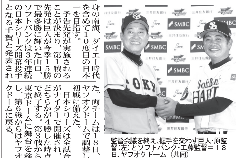
監督会議を終え、握手を交わす巨人・原監督(左)とソフトバンク・工藤監督(右)。

山口、千賀が先発 きょう日本シリーズ開幕 プロ野球 【共同】プロ野球のMLB日本シリーズ2019は19日にヤフオクドームで開幕し、5年ぶりにセ・リーグを制した巨人と、パ・リーグ2位のソフトバンクが対戦する。巨人は7年ぶり23度目、ソフトバンクは前