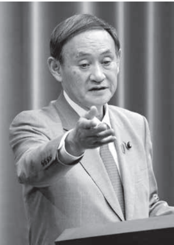
記者会見する菅官房長官=18日午後、首相官邸

【共同】安倍首相は18日、国家安全保障会議（NSC）会合を首相官邸で開き、中東情勢の悪化を踏まえて自衛隊の派遣を本格的に検討するよう関係閣僚に指示した。イラン沖のホルムズ海峡の安全確保を目指す米国の有志連合構想には参加せず、独自に派遣する方針だ。ホルムズ海峡を避け、アラビア半島南部のオマーンやイエメン沖に艦船や哨戒機を出して情報収集に当たる案を軸に年内にも決定する。菅義偉官房長官は派遣根拠を防衛省設置法の「調査研究」と説明した。