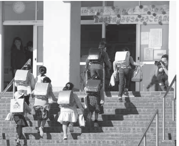
再開した丸森小学校に登校する児童=23日午前、宮城県丸森町

【共同】台風19号で大きな被害を受けた宮城、福島両県で23日、休校が続いていた公立校のほぼ全校が再開した。一部では断水したまま、敷地が陥没しているほか、避難所となっている学校もある。各校の教職員らが安全を確認した上で再開に踏み切った。登校した児童らからは笑顔も見えた。不安を抱えながら、日常を取り戻す動きが続き、一方、浸水が深刻な長野市は小中4校で依然、休校している。