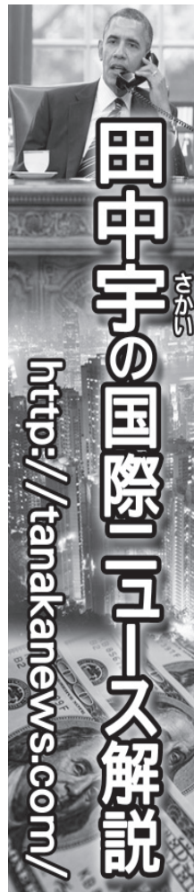
田中宇の国際ニュース解説