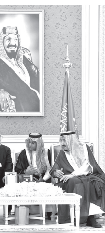
10月14日、サウジアラビアを訪れたプーチン大統領