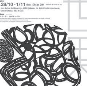
イベントの案内広告

ブラジル2019「手仕事」つながる世界報「共生」。海外での作品展開催は初となる。「世界報」はウチナーグチで「平和で豊穡な世」を意味するUSP展示会場では、ゆがふ舎の活動に参加する芸術家30人による染織、陶器、書道、写真などの手芸作品が楽しめる。日本から14人が来伯予定。開催は29日〜11月1日の午前10〜午後8時で、29日午後6時から開会式を行う。期間中のワークショップは