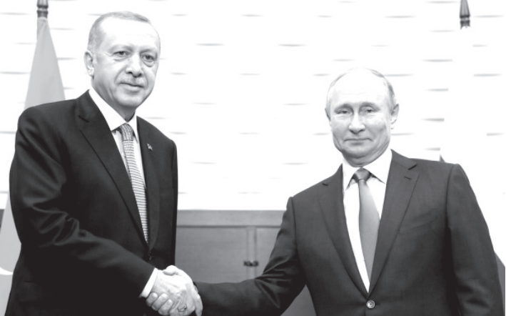
10月22日、トルコのエルドアン大統領を訪れたプーチン大統領

トランプ弾劾の危険が増すとパノンは考えている。弾劾される危険があるなら、トランプは「パックス・ルツソ」を推進する必要がある。それが意外に速い展開につながっているのかもしれない。