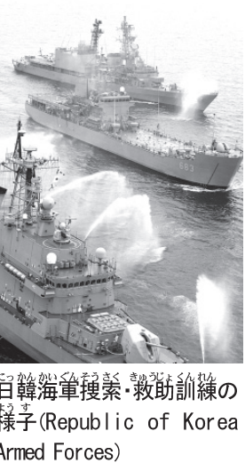
日韓海軍捜索・救助訓練の様子