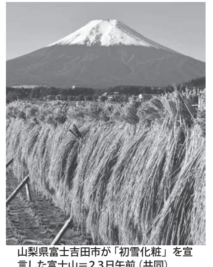
山梨県富士吉田市が「初雪化粧」を宣言した富士山=23日午前

【共同】山梨県富士吉田市は23日、富士山の「初雪化粧」を宣言した。甲府地方気象台が発表する「初冠雪」とは別、市が独自に確認しており、昨年より8日遅い。気象台は22日に初冠雪を発表している。