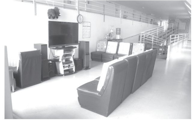
大きなテレビのある談話スペースも