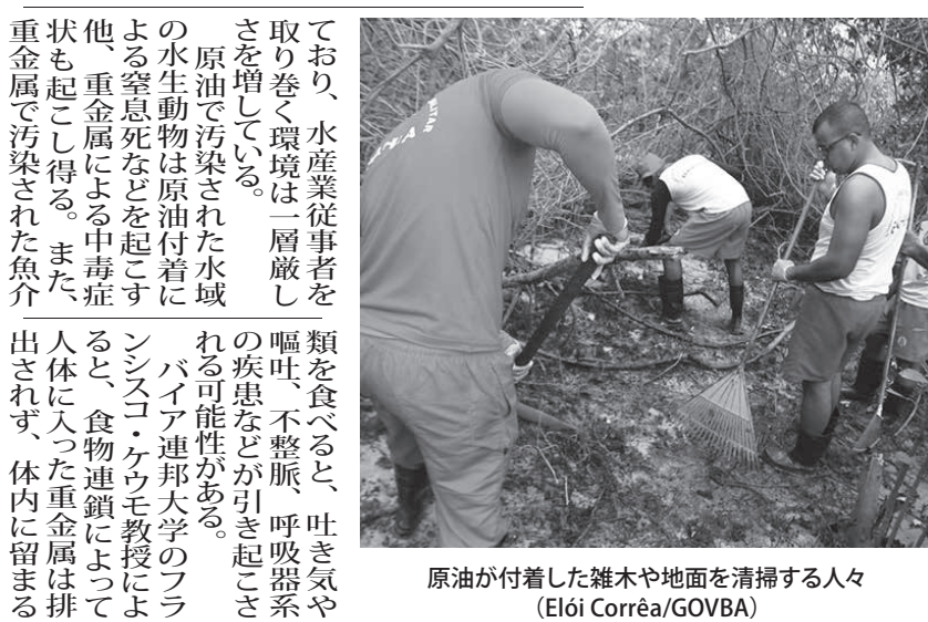
原油が付着した雑木や地面を清掃する人々

【既報関連】8月30日以降、北東部への原油汚染が、人体への健康被害や、魚介類の重金属汚染が確認され始めた。23、24日付の紙が報じている。原油が漂着した市や海岸に関する報告は、8月30日以降、連日繰り返されている。今月初旬は漂着が止まっていたが、ナンブコ州では、24日未明も北東部アマラカ市やパウリスタ市のピラ