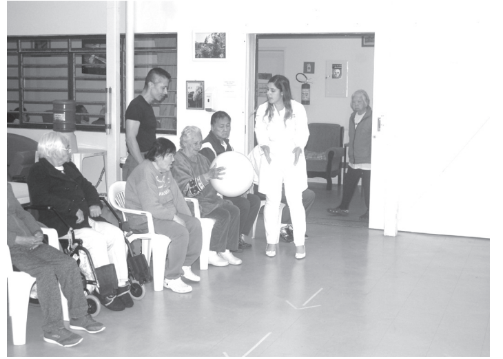
遊びながら運動を楽しむ入居者