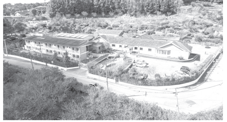
さくらホームの外観