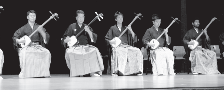
グループ民による11人の「津軽じょんがら節」