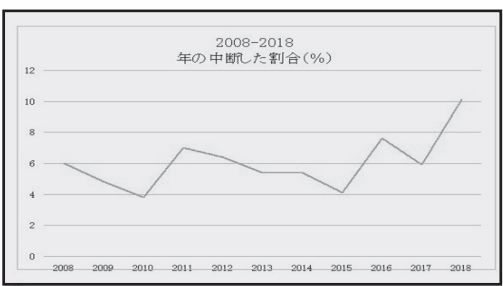
図1:治療中断者の割合(2008—2018年)ブラジリア保健局発表

2003年から2018年の間に合計58万6112件、そのうち15歳未満が4万4799件、また「グレード1(段階2)」の障害が3万7390件報告されています。(出典はブラジル保健省SUS情報局)