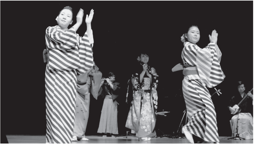
優美も公演に協力