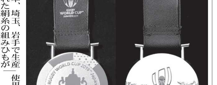
ラグビーW杯日本大会の金メダル。表面(左)には優勝杯「ウェーブ・エリス・カップ」、裏面には桜などが描かれている。

【共同】ラグビーワールドカップ(W杯)日本大会組織委員会と国際統括団体ワールドラグビーは29日、決勝、3位決定戦で授与されるメダルのデザインを公表した。