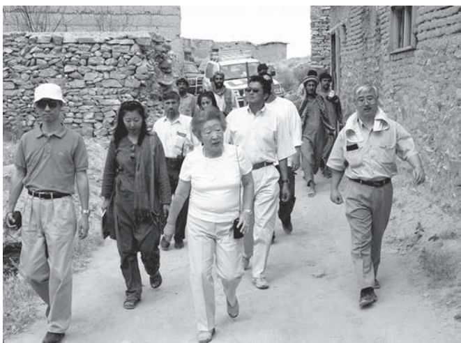
2002年6月、カブール郊外のジョマリ平原の村を視察する緒方貞子（中央）と夫のアフガニスタン復興支援日本政府代表

【共同】日本人初の国連難民高等弁務官として難民支援に貢献した国際協力機構（JICA）元理事長の緒方貞子（おがた まさこ）さんが22日午前2時18分、東京都内の病院で死去した。92歳。東京都出身。JICAが29日発表した。葬儀は近親者で29日に実施した。後日「しのぶ会（仮称）」を執り行う。安倍晋三首相は「世界の平和や安定、発展に長年にわたり多大な貢献をされた。心からの敬意と深い感謝を表す」とのメッセージを発表した。