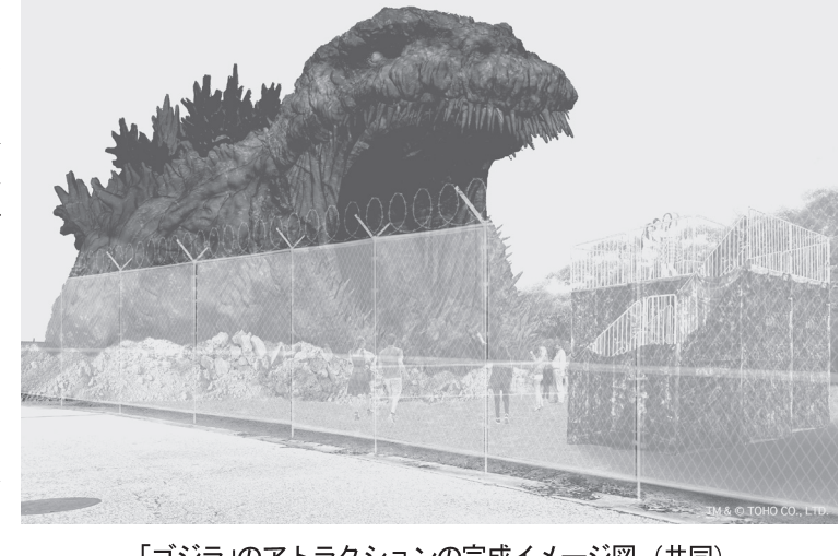
「ゴジラ」のアトラクションの完成イメージ図（共同）

【ニューヨーク共同】ニューヨーク市議会が、フォアグラの禁止をめぐって、2022年から禁止する条例案を可決した。フォアグラは、動物の肝臓を加工した肉で、動物愛護団体などから「危険種」とされている。