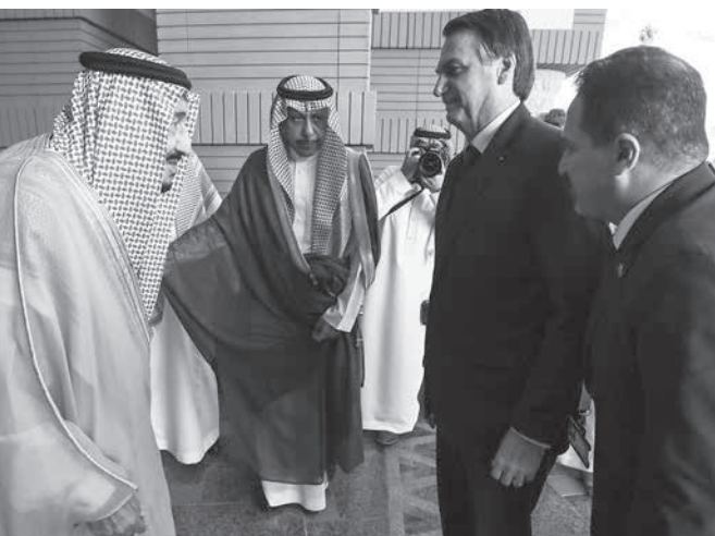
10月30日のサウジアラビアでのボウソナロ大統領

ボウソナロ大統領は10月21日から中国に続き、26、29日に中東3カ国を訪問、外交交渉を行った。これにより、サウジアラビアから巨額の投資を呼び込むなどの成果があった。10月28、30日付付伯字紙、サイトが報じている。 ボウソナロ大統領は「わが国には提供できるものが豊富にあり、我々もあなたたちから多くのものを手に入りたい」と語り、企業家たちの前では、「わが国には提供できる保障制度改革を行っていき、歴史始まって以来の低失業率も下がりつつある」と経済の回復をアピールした。 大統領はまた、アブダビのムハンマド・ビン・ザイド皇太子兼UAE軍副最高司令官、ドバイ首長国のムハンマド・ビン・ラシド首相とも面会を果たした。UAEとの間では通商協定や、人工知能分野、環境、防衛などに関する協定を結んだ。 ドバイ、アブダビの両首長は「アラブ首長国連邦は中東の貿易の入り口として重要」との主張を展開していた。 28日にはカタールに渡り、ドバイとタミム