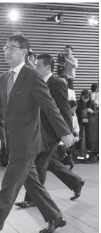
9月、法相に決まり、首相官邸に入る河井克行氏

今週発売の週刊文春によると、案里氏の選挙事務所が、7月の参院選で運動員13人に対し、1日当たり13人に対し1万5千円を超す3万円の支出があったと指摘している。河井氏は「妻の選挙活動は夫と別々で、2人の政治活動は一体化して」と証言もした。河井氏自身も、事務所が有権者にジャガイモなどの贈答品を配った疑いがあること、河井氏は辞表提出後、