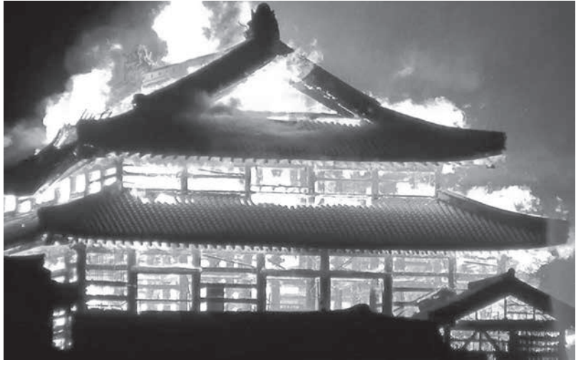
激しく燃え上がる首里城の正殿=10月31日午前4時20分ごろ、那覇市

【共同】10月31日午前2時ごろ、那覇市の首里城から出火、木造3階建ての正殿が全焼するなど、主要7棟の計4千4百平方メートル以上が燃え、約11時間後に鎮火した。周辺住民30人以上が一時避難したが、けが人はない。正殿内部から火が出たとみて、沖縄県警と消防は1日に現場で実況見分し、出火原因を調べる。