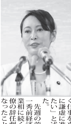
就任記者会見をする森法相(10月31日午後、法務省)