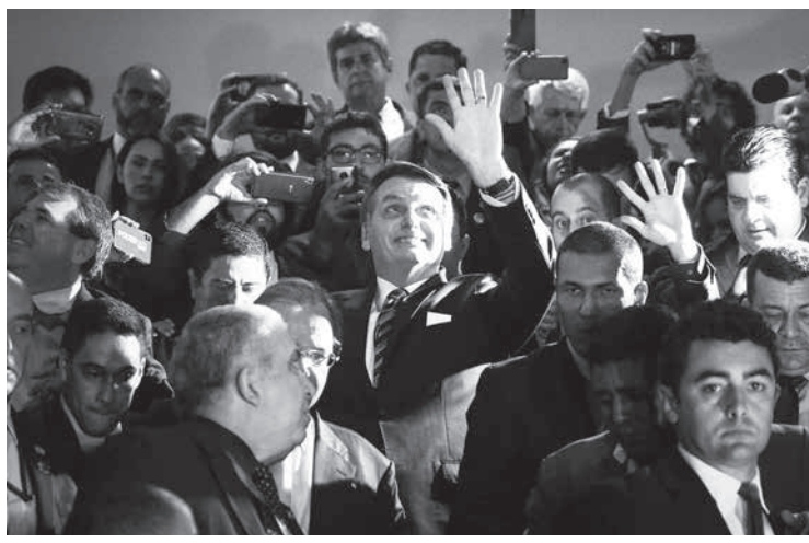
5日のボウソナロ大統領

現在、ボウソナロ大統領はPSLの不正を糾弾し、自身を支持する議員たちと離党することも検討しているが、同党が対立しているボウソナロ氏と激しく対立しているボウソナロ氏の選挙の助けにもなっていたと3日付フオーリャ紙が報じている。