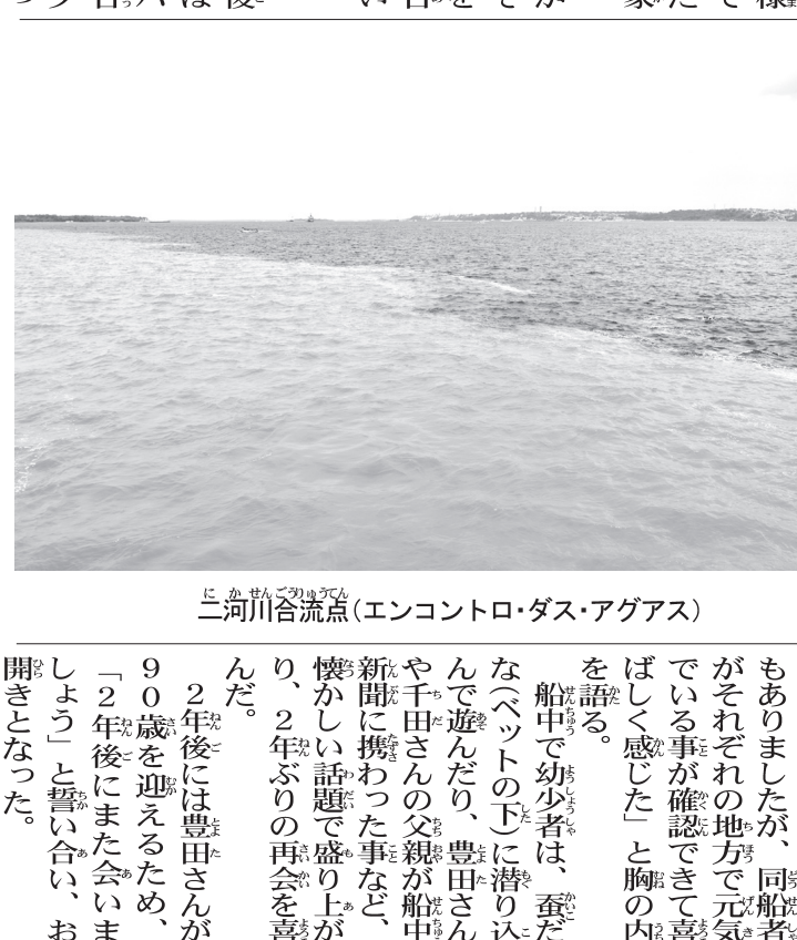
二河川合流点(エンコントロ・ダス・アグアス)

「マナウスの夕食会は夜10時頃まで続いたため、連日ハードなスケジュールをこなす故郷巡り一行は、残念ながら途中でホテルに戻ることにした。