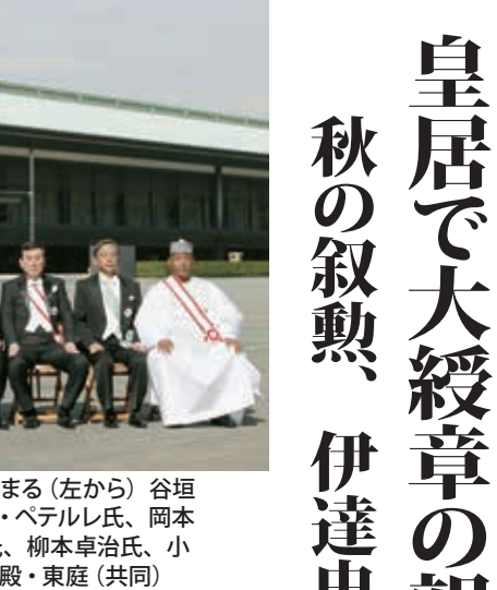
秋の叙勲の大綬章親授式を終え、記念写真に納まる(左から)谷垣...