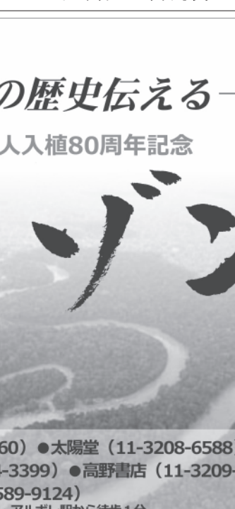
出席者らの集合写真