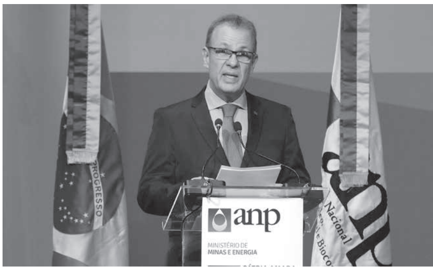
ペント・アルケルケ鉱動相

予想額の7割、国際企業参加せず 来年の財政に暗い影響落とす リオで6日、リオ州沖四つの海底岩層(プレ・サル)油田の開発権公開入札が行われたが、落札総額は事前に連邦政府が想定していた1065億レアルを大きく下回る約699億レアルにとどまった。7日付付字各紙・サイトが報じた。 入札にかけられた海底油田の鉱区は、ブジョス、イタプ、セビア、アタプの4カ所だったが、落札されたのはブジョスとイタプだけで、セビアとアタプには入札がなかった。前日までは、政府は世界的石油メジャーが入札に参加すると期待していたが、蓋を開けてみれば、入札に参加したのは国内企業のペトロブラス(PB)と、中国海洋石油(CNOOC)、中国石油(CNODC)のみだった。 PBはブジョスをコンソシアム(CNOC)、CNODCとの共同事業で単独で経営する。ブジョス開発に5%ずつ参画する中国の2社は、セビアやアタプの入札には参加しなかった。