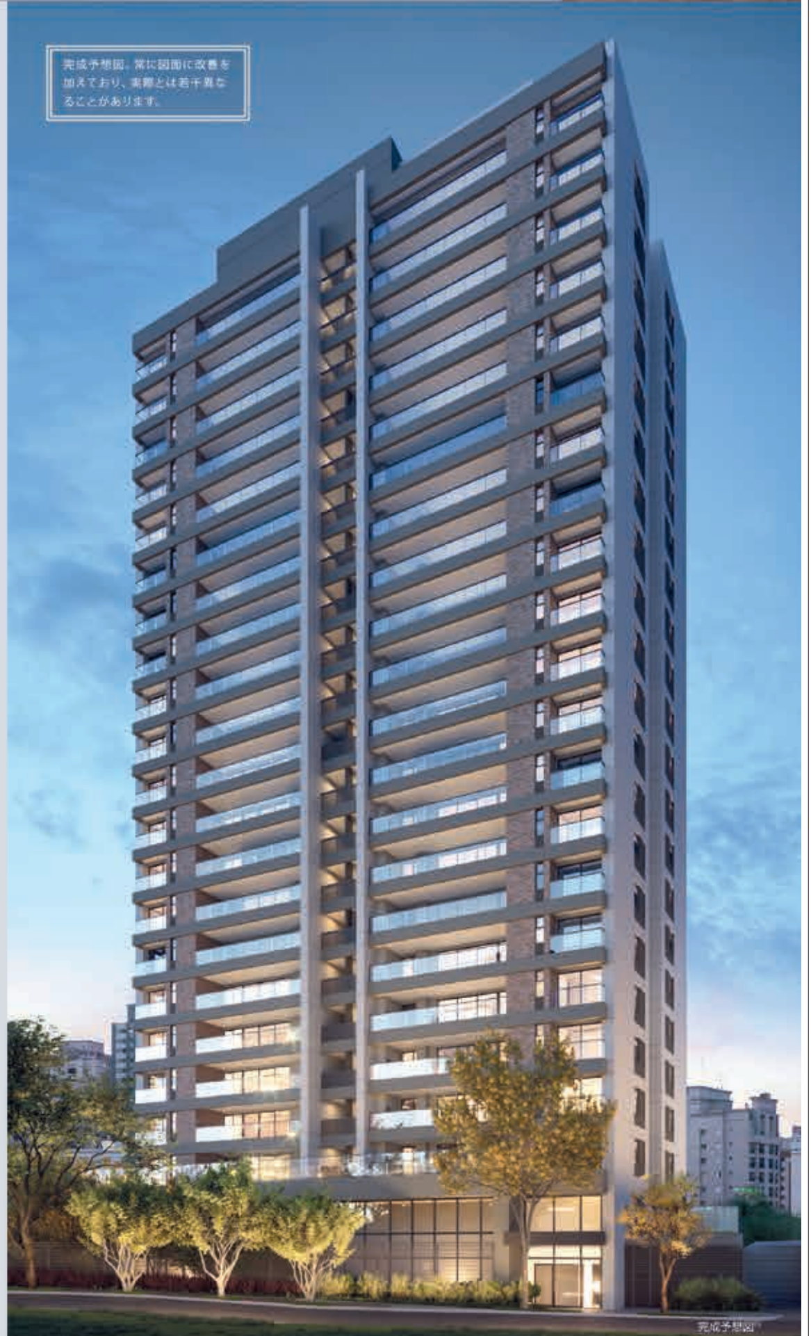
完成予想図。常に図面に改善を加えており、実際とは若干異なることがあります。

RUA DR. NETO DE ARAÚJO, 303 – ヴィラ・マリアナ駅から徒歩2分