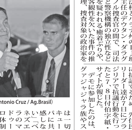
ボウソナロ大統領