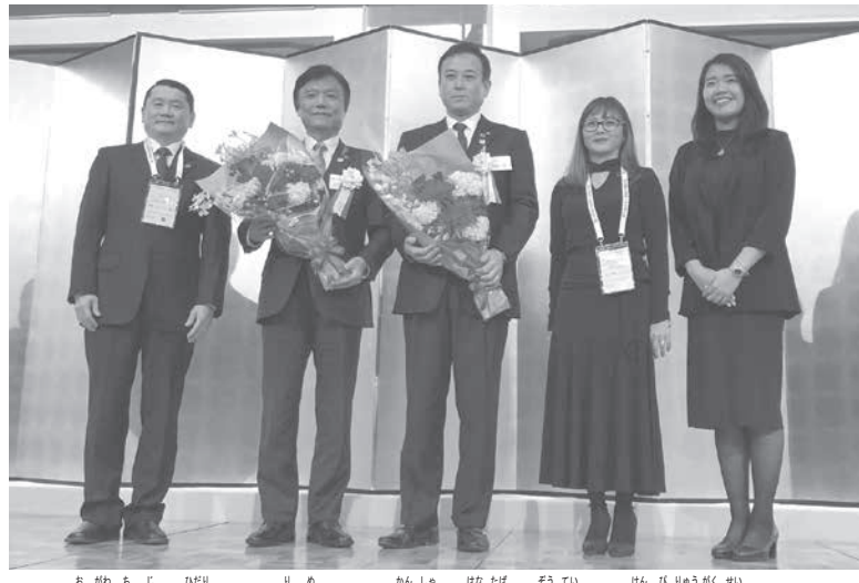
小川知事（左から2人目）らに感謝の花束を贈呈した県費留学生たち

【福岡県発】福岡県は7日、福岡市内のホテルニューオータニ博多で「福岡県費留学生50周年記念式典」を開催した。おりしも同市では「海外福岡県人会世界大会」が開催中で、小川知事をはじめ、県費留学生や福岡県海外移住家族会議員、世界大会のため来日している各国県人会長や関係者ら約100人が出席し、半世紀の節目を祝福した。