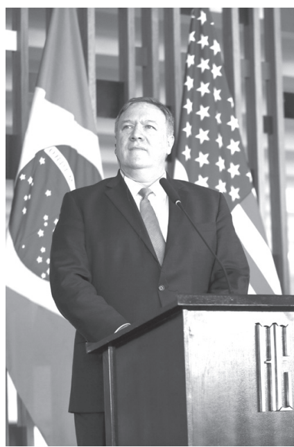
ボウソノ大統領の就任式に出席したポンペオ国防務長官。今年1月2日に記者会見した時の様子

米国防務長官ポンペオは9日、世界に呼びかける決意を「世界に呼びかける米国防務長官ポンペオの宣戦布告」で発表した。米国防務省は、中国共産党政権は、米国の価値を否定し、世界の民主主義価値を脅かしているとして、中国と対決することを求める決意を述べた。 ポンペオ氏は、中国共産党政権は、米国の価値を否定し、世界の民主主義価値を脅かしているとして、中国と対決することを求める決意を述べた。 ポンペオ氏は、中国共産党政権は、米国の価値を否定し、世界の民主主義価値を脅かしているとして、中国と対決することを求める決意を述べた。