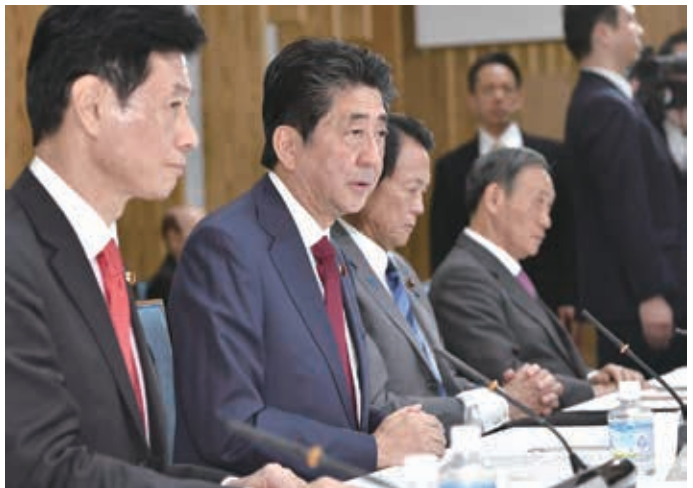
経済財政諮問会議であいさつする安倍首相(左から2人目) =5日午後、首相官邸

【共同】政府は5日、臨時閣議を開き、事業規模26兆円となる経済対策を決定した。台風19号などの大規模災害からの復旧・復興を加速し、「国土強靱化」を推進する。景気不振を緩和し、東京五輪後も見据え、2019年度補正予算案と20年度当初予算案を合わせた「15カ月予算」を編成。中小企業支援やIT教育の普及策などを盛り込んだが、国・地方の財政支出は13兆2千億円に達し、国の借金は一段と膨らむ見通しだ。