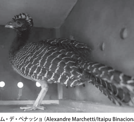
絶滅の危機にあるムツム・デ・ペナツジョ

伯国とアルゼンチン(亜国)、パラグアイの国境が接する三角地帯にあるイタイプー水力発電所の環境班が、絶滅危機種の鳥10羽を放鳥する事を明らかにした。