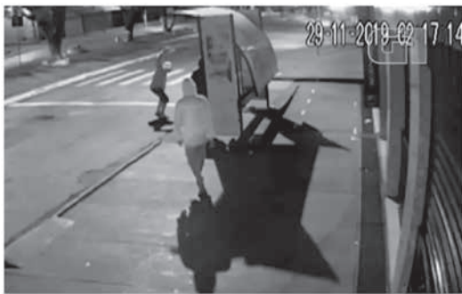
Os três estão apreendidos e vão responder pelo ato infracional equivalente ao homicídio. Eles serão encaminhados a uma audiência na justiça, que vai determinar se eles serão soltos ou se serão encaminhados para a internação.