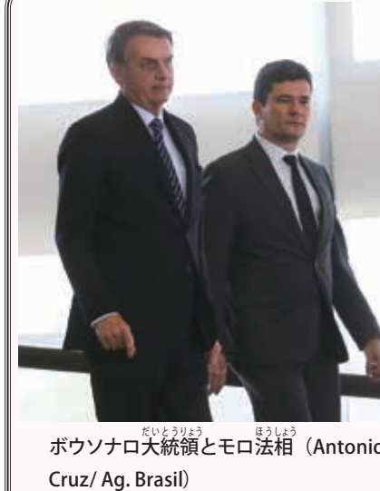
ボウソナロ大統領とモロ法相