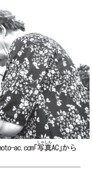
墓参りをする女性

「強欲が所以に 苦しむ老後」 「私」の老後、こんなはずではなかった、という思いは何処から生まれるのであろうか。世界には多くの宗教があるが、仏教は自然の法則を信奉する。そして人間にとって切り離すことのできない煩悩を鎮め