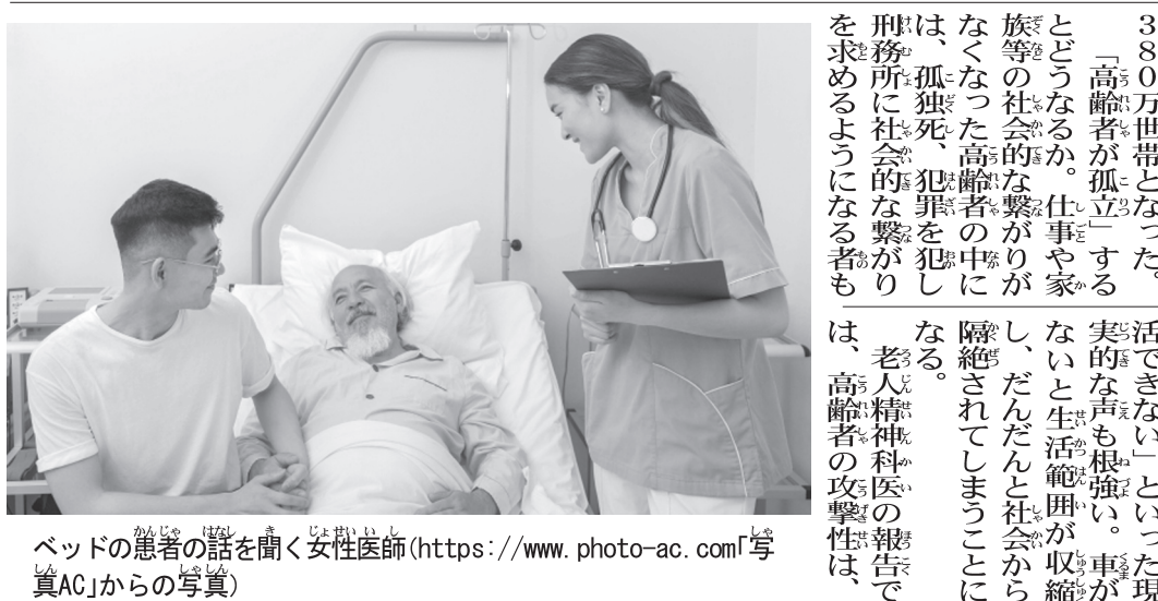
ベッドの患者の話を聞く女性医師

9割方は高齢者といっている。総合病院の隣には高齢者向け介護施設を併設している。認知症患者にヘルパーが付き添っている。大声、奇声を上げる患者に対し、慣れない者は驚きと緊張でついその方向を見てしまいが、その場の来客者もヘルパーも看護師もすっかり慣れた様子である。中には、「わしらもすぐにああなるんじや」とひそひそつぶやく人もいる。患者はすべて年を取ればかかるであろう病気で来院している。高齢社会はそういうもの、だからと教えてくれる場所である。