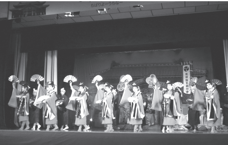
第2部でのきらびやかな舞いの様子