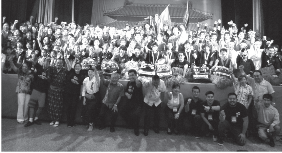
関係者ら一同で記念写真