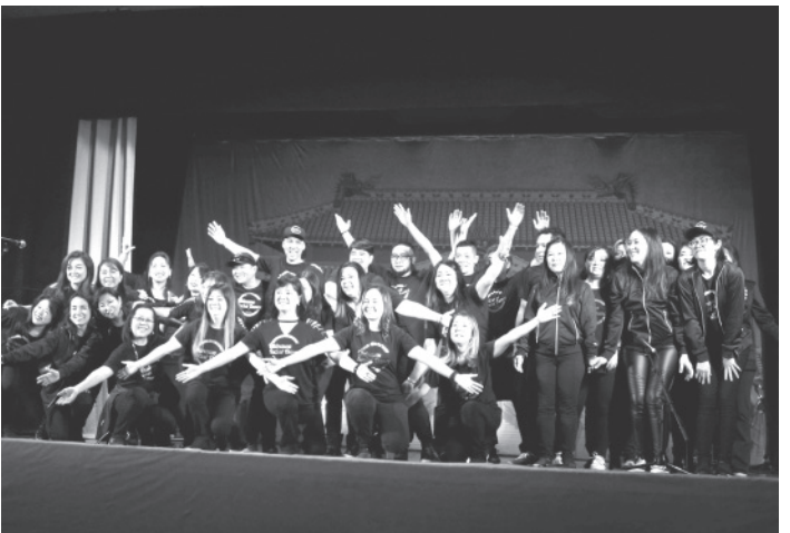
沖縄ソーシャル・ダンスが斬新なプログラムを披露した