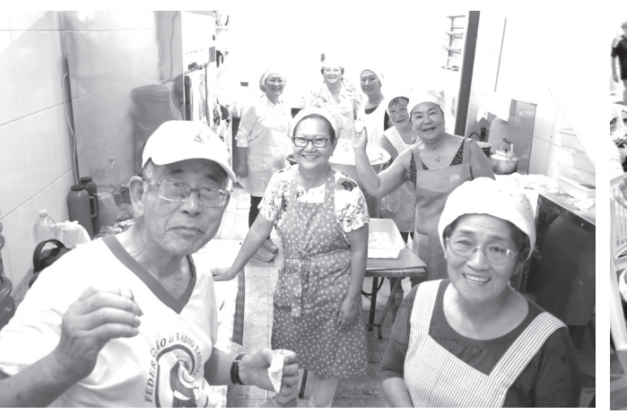
東洋会館の調理室ではACA L舞踊部(池之緑苑指導)の皆さんがお雑煮を準備