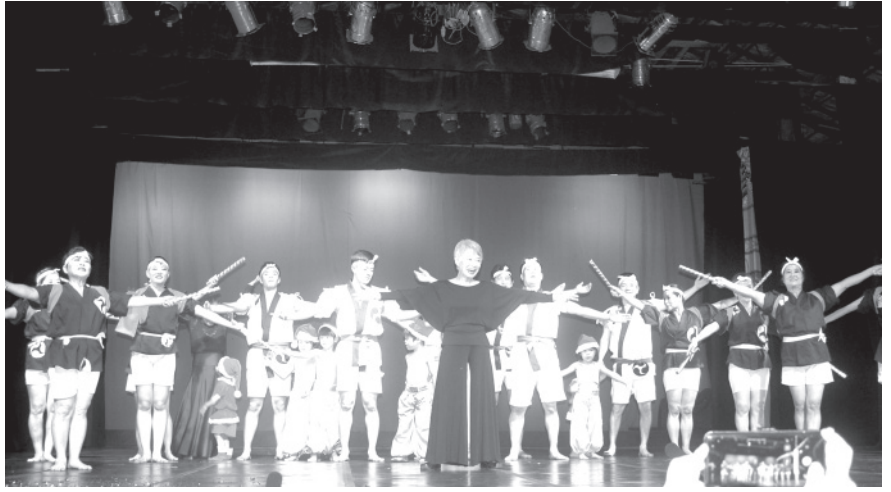
パレエの部フィナーレの様子