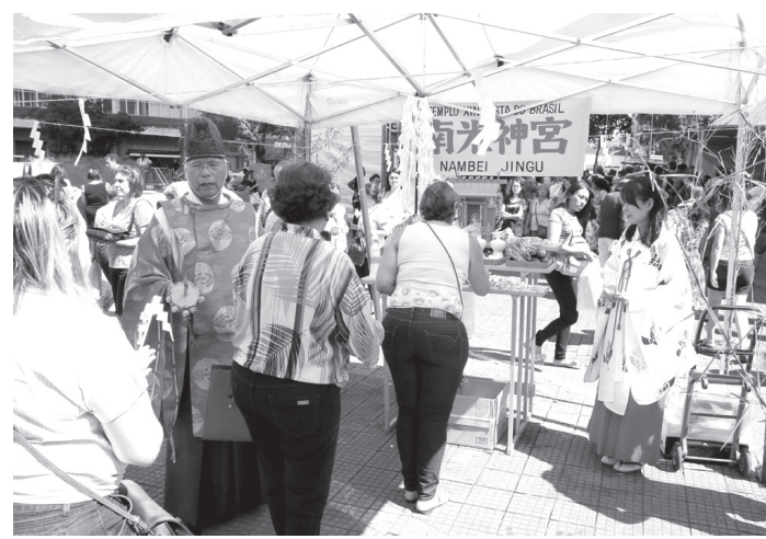
杵の輪ぐりをしたら、お祓いを受けて祭壇にお辞儀する