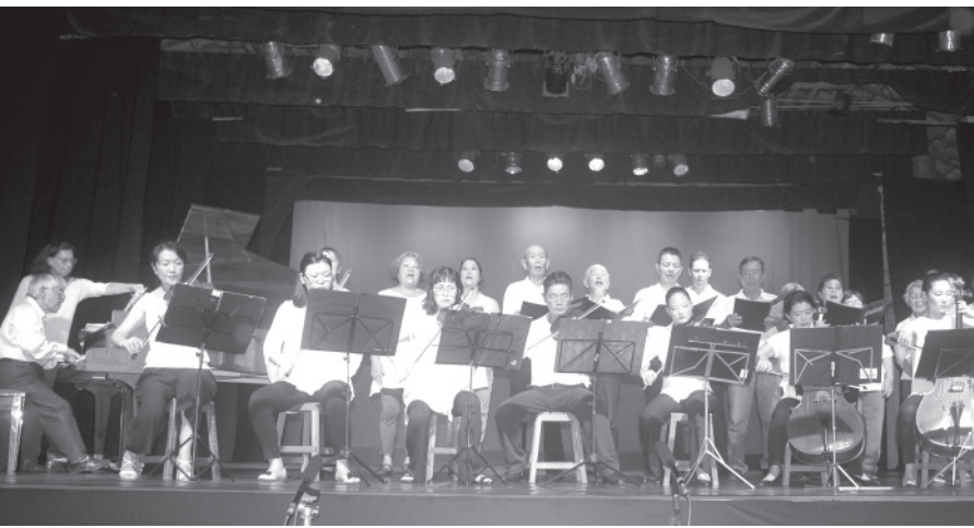
農場の住民らで奏で合唱した