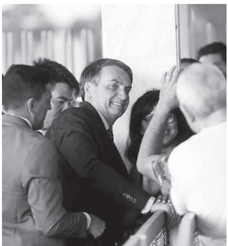
2日のボウソナロ大統領

数字そのものは、歴代の調査でもわりと高い方だが、2018年の大統領選の只中に行われ、過去最高を記録した69%と比較すると、7%ポイントも後退した。