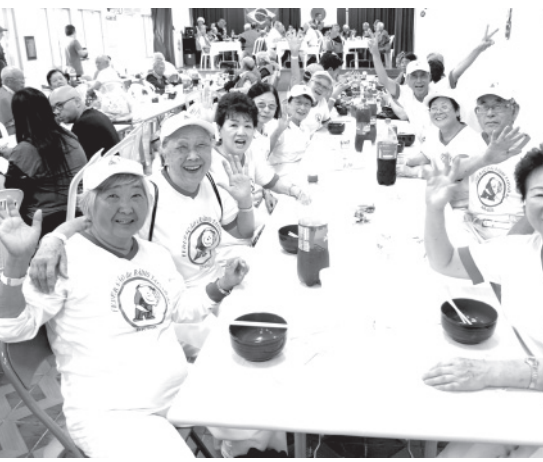
広場で餅を配り終えたブラジルラジオ体操連盟の皆さんが昼過ぎには東洋会館に谷流し、お雑煮と一緒に食べていた