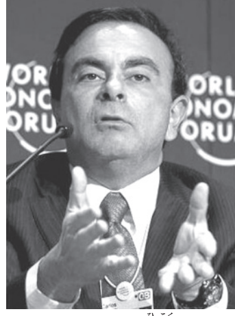
カルロス・ゴーン被告

全世界のアム通譯者の皆、山崎鉄秀です。年末のカルロス・ゴーン被告の逃亡劇には驚きましたね。こんなことが起こり得るのです。まあしかし、間抜けな話です。あの「のんびりリベラル」のカナダでさえ、H U A W E I (ファーウェイ)の副社長(フアウェイ)の副社長の出国を許していません。このあたりの分析は専門家にお任せするとして、私が強調したいのは、このような局面で日本政府として国際社会に對してどのようなアピールをすべきか、ということ