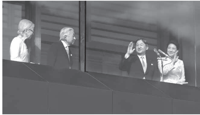
新年一般参賀で手を振られる天皇、皇后両陛下に体を向けられる上皇ご夫妻=2日午前、宮殿・長和殿

【共同】令和初となる新年恒例の一般参賀が2日、皇居で行われた。天皇陛下は皇后さまや上皇ご夫妻、秋篠宮ご夫妻ら皇族と宮殿・長和殿に立ち「本年が災害のない、安らかなで良い年となるよう願っております。年の始めに当たり、わが国と世界の人々の幸せを祈ります」とあいさつされた。天皇代替わり後、陛下と上皇さまがそろって国民の前に姿を見せるのは初めて。