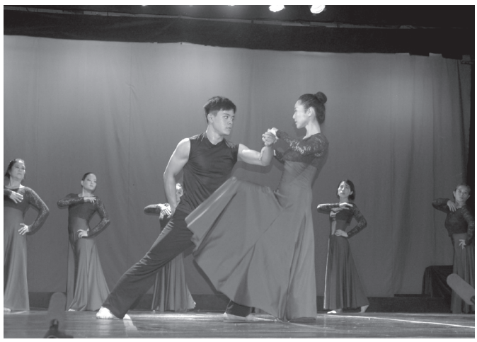
優雅に舞って見せたパレエの部

聖州ミランドーポリス市の弓場農場の住民らが12月25、30両日、演奏やパレエ、演劇を披露する、恒例の「クリスマスの集い」を開催した(詳細は7面)。当日の様子を写真グラフィで伝える。