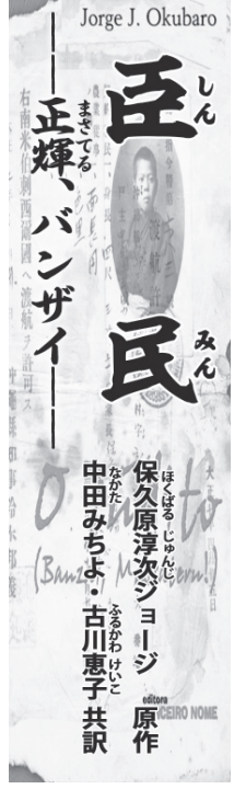
「正輝、バンザイ」 保久原淳次ヨージ 原作 中田みちよ・古川恵子 共訳 (197)

【共同】政府は2020年春をめ、地域の中小企業が求める人材を地銀が紹介する新たな制度を始める。参加が相次いでいる地銀の人材紹介業務を後押しして、中小企業の生産性向上につなげるのが狙い。後継者不足の解消にも期待する。