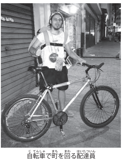
自転車で町を回る配達員

またエスタード紙昨年9月15日付け記事で、同紙17日付け本紙2面翻訳記事では、配達員の賃金の低さも問題として挙がっている。