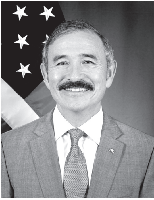
ハリソン・ハリス大使。元第24代アメリカ太平洋軍司令官、アメリカ海軍史上初めてのアジア系(日系)の大将、大将の地位は日系アメリカ人軍人が得た過去最高の階級

▼韓国のハリス大使バッシング JB Press 1月22日、李正宣さんの記事 「米海軍も、我々の意志と希望事項について十分理解している」(東京和外交渉局長) 「ハリス大使が、この方針に反対しました」(韓国人による北朝鮮制裁効果をもたらす可能性)