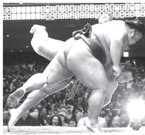
貴景勝(手前)が小手投げで栃ノ心を下す=両国国技館

【共同】大相撲初場所 12日目(23日)両国国技館 大関貴景勝は平幕栃ノ心を小手投げで下し、2敗を守った。平幕の正代、徳勝は1敗を守り、首位をキープした。正代が小結阿炎を、徳勝は輝をともに突き落とした。