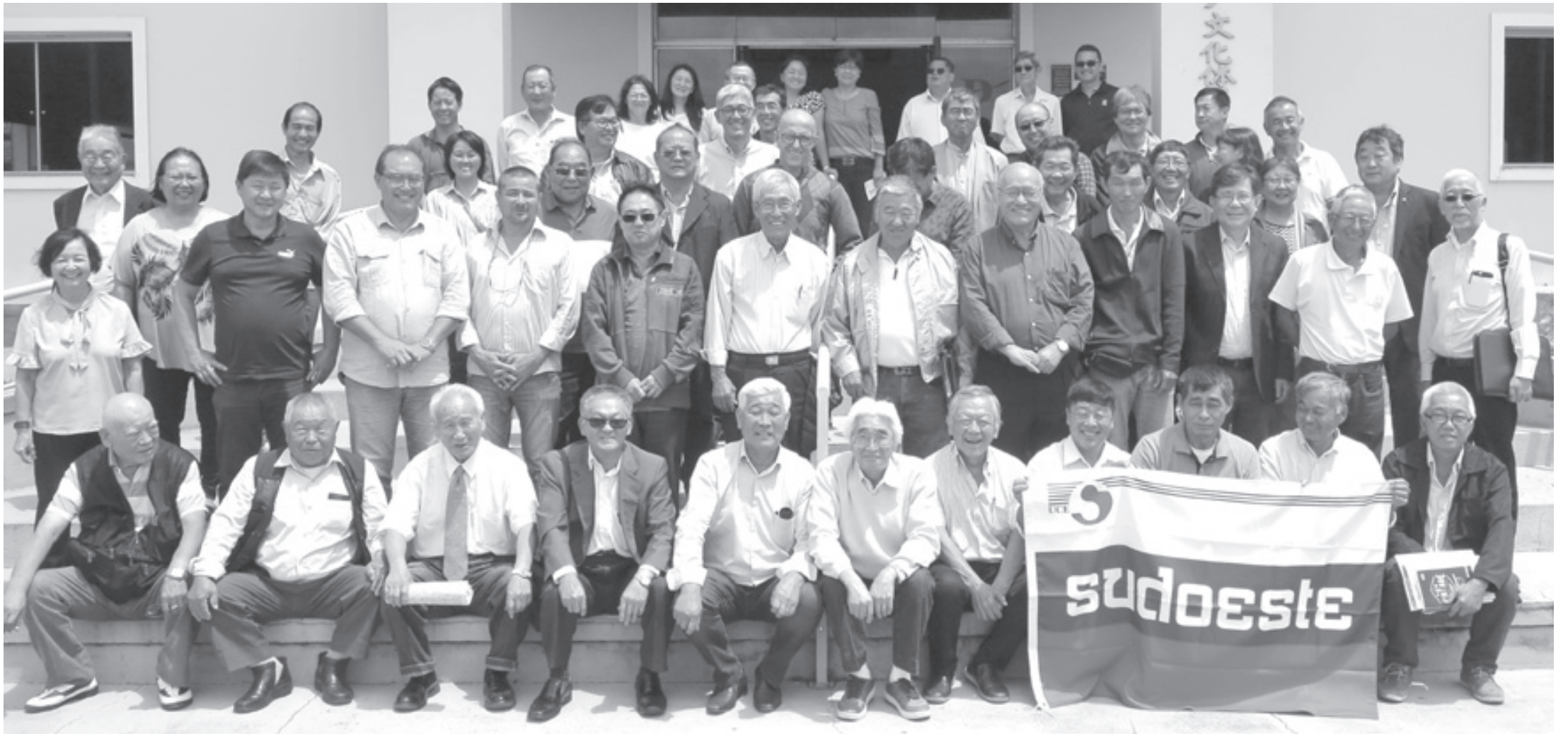
聖南西文化体育連盟の2020年定期総会に参加した代表者の皆さん