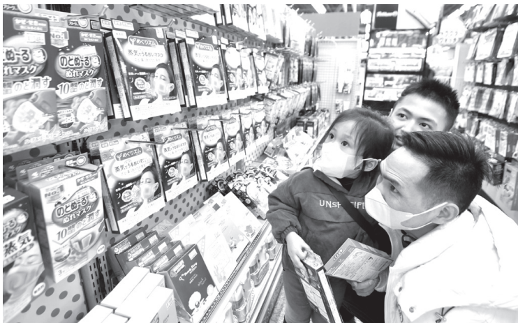
春節の大型連休中に日本を訪れ、マスク売り場で商品を見る中国人観光客。中国では高性能の高いマスクは品薄だといわれ、27日午後、東京・秋葉原のヨドバシカメラ(共同)

相次いだ。土日に社員が泊先まで連絡し、27日も朝から対応した。中国の旅行会社から委託を受け、宿泊先や交通機関を手配している大手旅行会社は、春節期間中にあった。中国からの依頼は全てキャンセルと述べた。旅行大手の「KNTCTホールディングス」(東京)は、日本からウイグルが猛威を振るう中国・武漢市へ行くツアーが全額払い戻し対象に。担当者は「北京や上海などへの旅行もキャンセルされ、影響の拡大を口にした。」