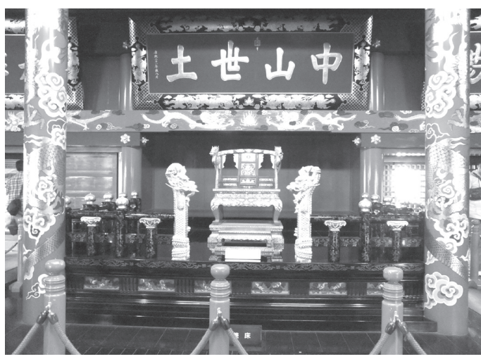
正殿内部の玉座(復元)

その全文を紹介すると、「このニュースを知って火災が発生した時間帯を見てびっくりした