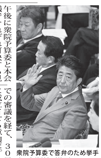
衆院予算委で答弁のため挙手する安倍首相

【共同】秋篠宮ご夫妻は28日、昨秋の台風19号で浸水被害に遭った福島県伊達市を私的に訪問し、特産の干し柿「あんぼ柿」などの生産農家の被災状況を視察された。