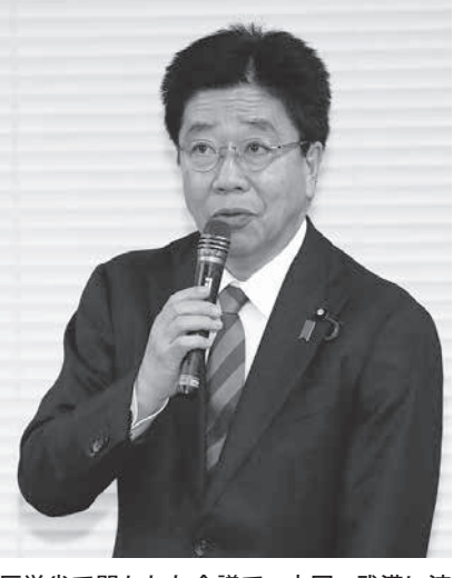
厚労省で開かれた会議で、中国・武漢に渡航歴のない新型コロナウイルス感染者の確認を発表する加藤厚労相

【共同】厚生労働省は28日、国内で新たに3例の新型コロナウイルス感染者が確認されたと発表した。1人は奈良県在住の60代日本人男性。バス運転手として中国湖北省武漢市からのツアー客を乗せたが、自身の滞在歴はなかった。厚労省はツアー客からうつったとみて感染経路を調べている。国内で人から人に感染したとみられる初の事例で、日本人の感染確認も初めて。