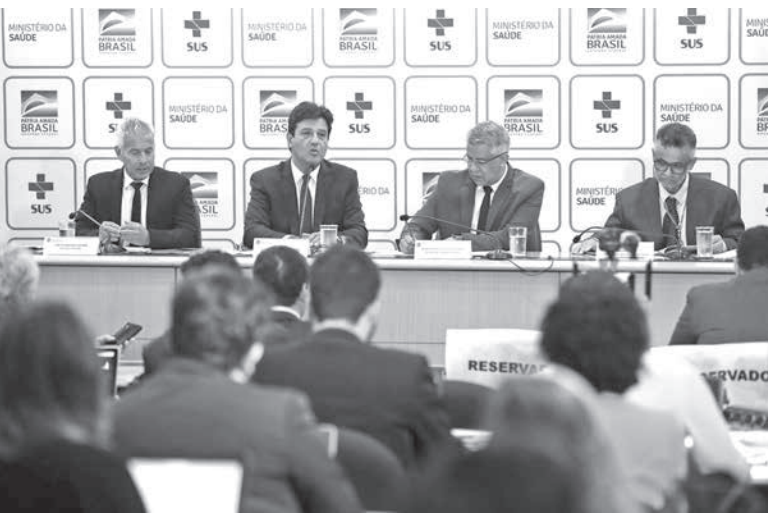
28日の保健省の記者会見

発生地・武漢に旅行後発症 危険レベルは「2」に上昇 中国で猛威をふるっている新型コロナウイルスに関連し、伯国保健省が28日、中国帰りのミナス州在住者(前回疑いが持たれた人とは別)に感染の疑いがあり、検査中と発表。感染危険度も「2」に引き上げると、予断を許さない状況となっている。28日付伯字サイトなどが報じている。