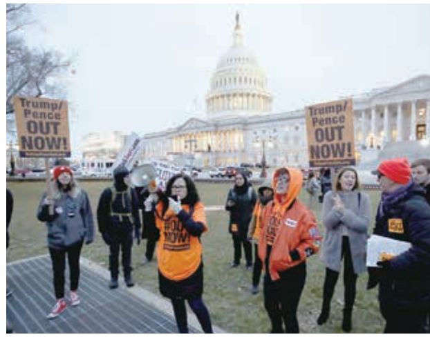
米連邦議会議事堂前で、トランプ大統領が弾劾裁判で無罪評決となったことに抗議する人たち

【ワシントン共同】田中光也(定数100)の弾劾裁判は5日、トランプ大統領のウクライナ疑惑を巡る「権力乱用」と「議会妨害」の2訴追事項について、いずれも無罪判決を出した。多数派を占める与野党両派が反対し、造反は1人しか出なかった。ただ疑惑は払拭されず、世論の賛否は拮抗。米社会の分断はさらに深まり、トランプ氏が再選を狙う11月の大統領選への影響は必至だ。