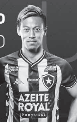
ポタフォゴ側も本田の加入を大きく盛り上げている

8日の入団イベントでは、U17チームの親善試合や人気DJショーなども行う予定だ。会見後には本人が、スタジアムでサポーターの前に姿を現す。開門は午前9時からで、保存がきく食料1キロの寄付が入場料の代わりとなる。 本田の加入が噂になってから、サポーターたちは「本田さんポタフォゴに来て、の書き込みを流行させたが、今度はチーム側が#HondaChegu(ポルトガル語で「#本田が着いた」の意を広めよう)」と意を込めた。