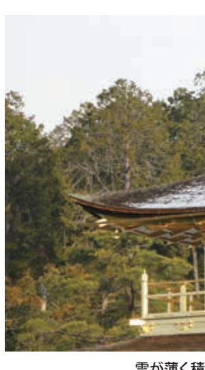
雪が薄く積もった金閣寺の屋根

【共同】国立国際医療研究センターは6日、国内で新型コロナウイルスの感染が確認された患者3人の治療経過を公表した。1人は抗エイズウイルス(HIV)薬を投与した後、症状に改善傾向がみられたとしている。国内で患者治療の詳細が明らかになるのは初めて。