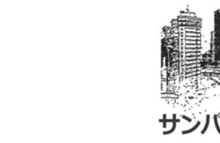
サンパウロ周辺 情報