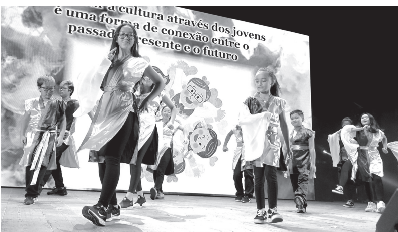
三つ葉グループ(カンピーナス日伯文化協会)の若者たちによるハツラツとした踊り