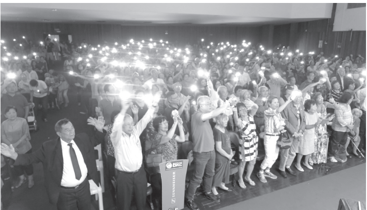
携帯電話のライトをつけて左右に振って、蛍の光を会場が大合唱