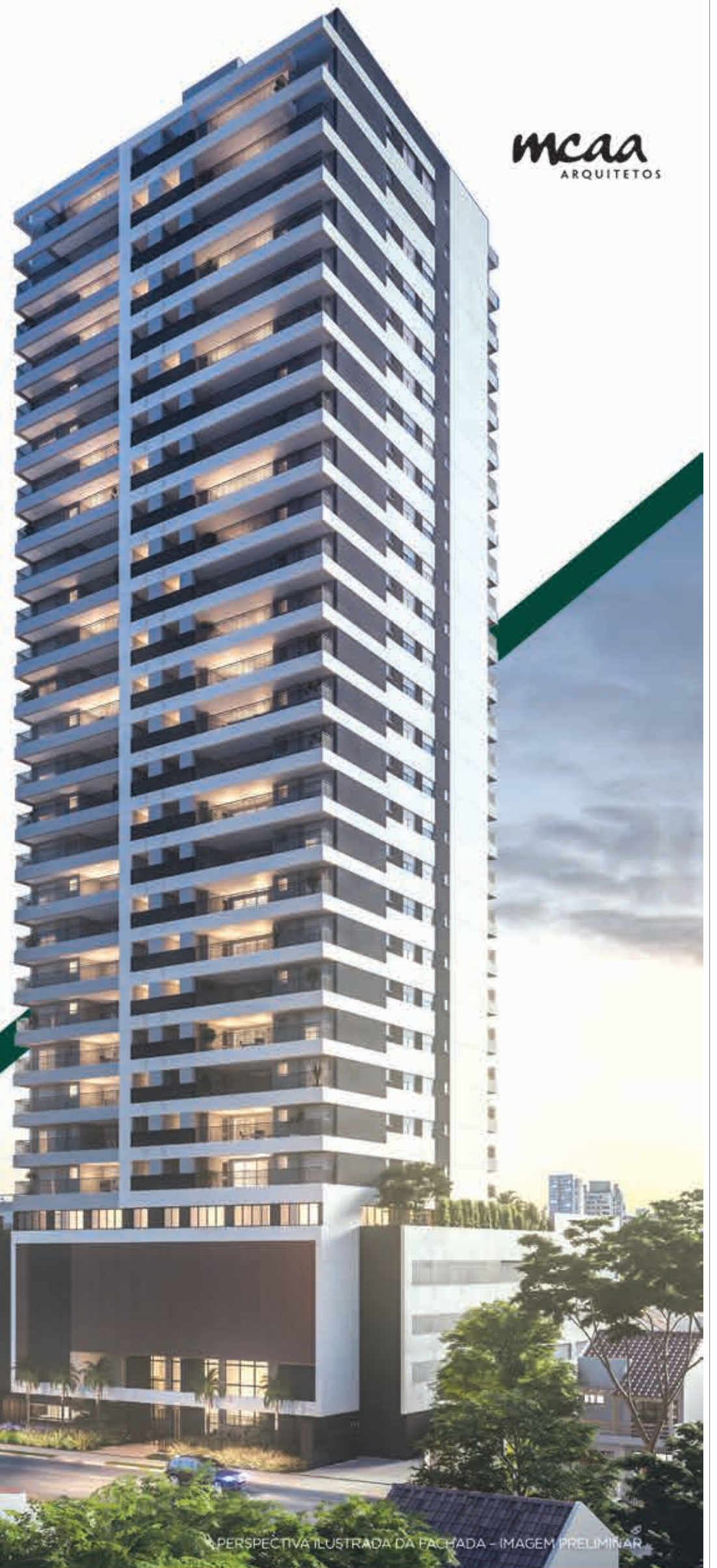
PERSPECTIVA ILUSTRADA DA FACHADA - IMAGEM PRELIMINAR