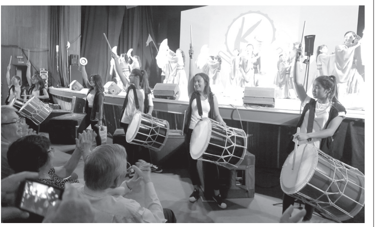
気炎太鼓、心響太鼓、雷神太鼓と三つ葉YOSAKOIソーラン