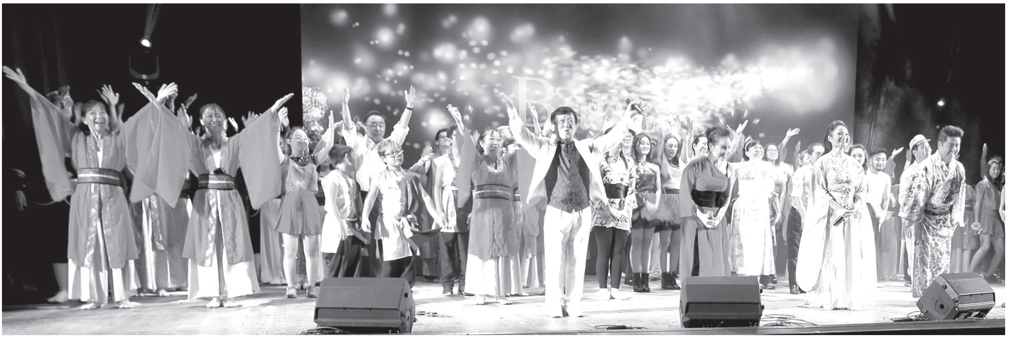
終幕時には全員が舞台に並んで盛大にフィナーレを飾った