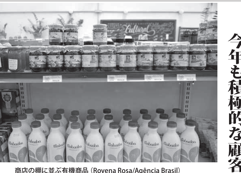
商店の棚に並ぶ有機商品

人々は落ち着いて、状況を理解しており、ストレスを溜め込んで帰国者同士で喧嘩したりという事もない。もちろん、一般社会から隔離されている検査され続けていることには、決して心地よいものではない。しかし、全員、検査などにも協力して、自分たちを中国から連れ戻してくれた政府に感謝していると語った。