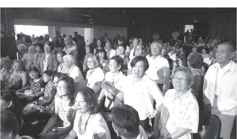
当日、憩の園の入園者も楽しみに見に来た