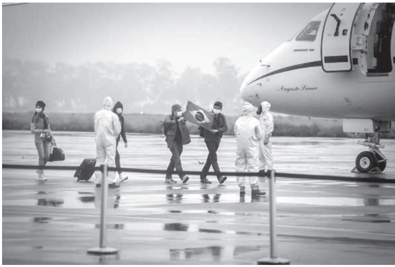
到着時に伯国旗を掲げて喜びを表する中国からの帰国者

中国湖北省武漢市で発生した新型コロナウイルスの影響で、現地でも身動きが取れなくなっていた伯人とその家族、合計34人が、伯国政府が派遣した空軍機に乗って帰国してから丸3日が経過した。