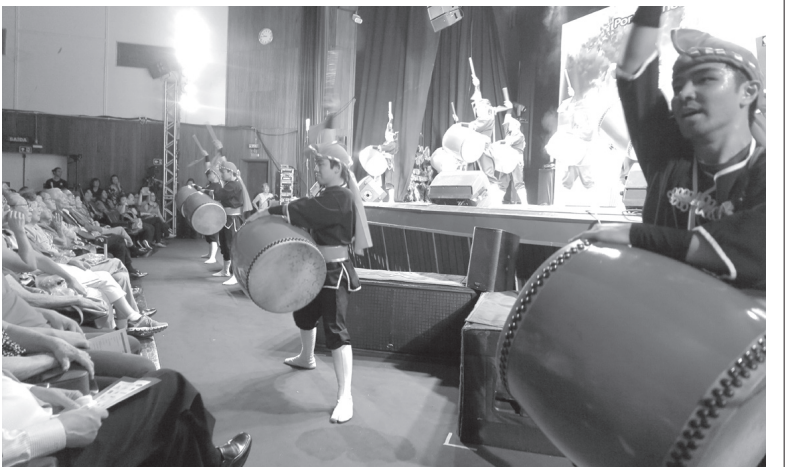
琉球國祭り太鼓の切れのある踊りと演奏