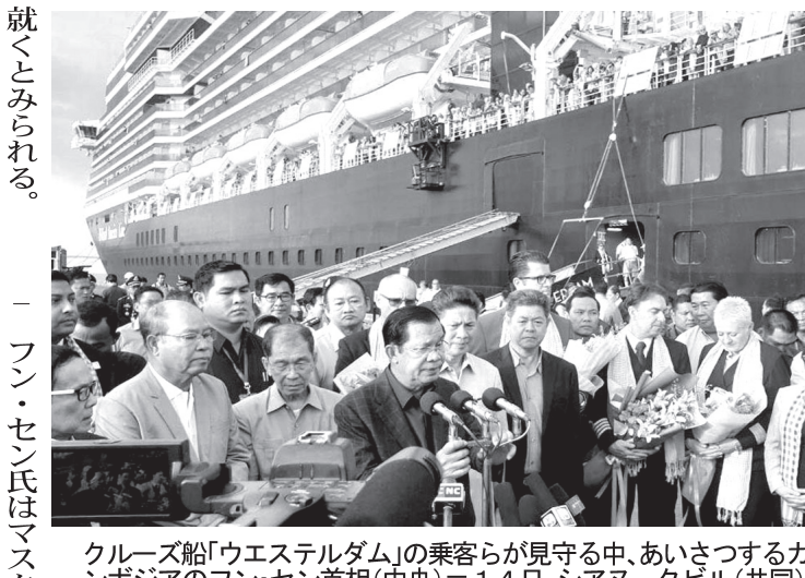
クルーズ船「ウエストエルダム」の乗客らが見守る中、あいさつするカンボジアのフン・セン首相(中央)＝14日、シアヌークビル

【北京共同】中国肺炎は14日、新型肺炎の感染者が6万4千人に迫り、死者が1380人に達した。