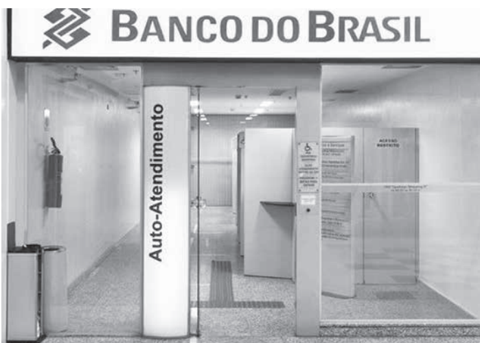
大幅な純利増を記録した伯国銀行 (Ag.Brasil)

昨年純利益178億レを計上 主要4銀行内で純利3位 伯国銀行(BB)は昨年第4四半期、前年同期比で20.3%増となる、46億レアルの純利益を計上。2019年全体の純利益は178億レアルで、前年比32%増だったことが分かった。13、14日付伯字紙各紙・サイトが報じている。純利益トップ4銀行の中で唯一の国営銀行であるBBのルベン・ノヴァエス総裁は、「BBが民営化されれば、より自由に、より効率的に経営でき、民間銀行を抜いて純利益1位になることも可能だ。そろそろBB民営化についての議論も始めるべき」と語っている。