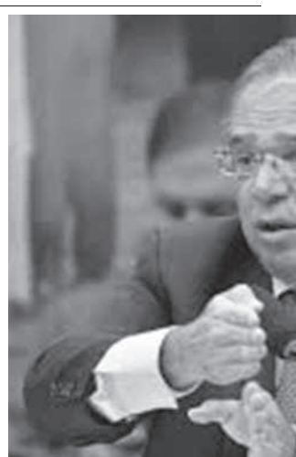
ゲデス経済相

税制や行政の改革の妨げに 「家政婦がドイツに」など、バウロ・ゲデス経済相の相次ぐ失言が、低所得層を中心とした国民や連邦議会を不快にさせ、税制改革や行政改革の法案が議会通過させる上で支障になっていると、14日付伯字紙が報じている。 ゲデス経済相は12日に行なった「ドル高は良いことだ。家政婦がドイツに」など、バウロ・ゲデス経済相の相次ぐ失言が、低所得層を中心とした国民や連邦議会を不快にさせ、税制改革や行政改革の法案が議会通過させる上で支障になっていると、14日付伯字紙が報じている。