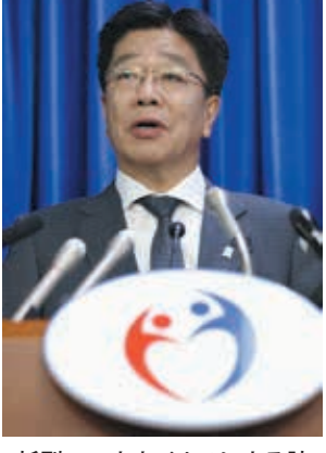
新型コロナウイルスによる肺炎の対応を巡り、記者会見する加藤厚労相=20日午後、厚労省

【共同】厚生労働省は20日、新型コロナウイルスの感染拡大を受け、イベント主催者に開催の必要性を改めて検討するよう要請する文書を公表した。屋内などで参加者同士が十分距離を取れないまま、一定時間のことなどが感染リスクを高めると例示するなど注意事項を列記した。人数などの具体的な基準は示さなかった。現時点で一律の自粛要請は行わないとした。