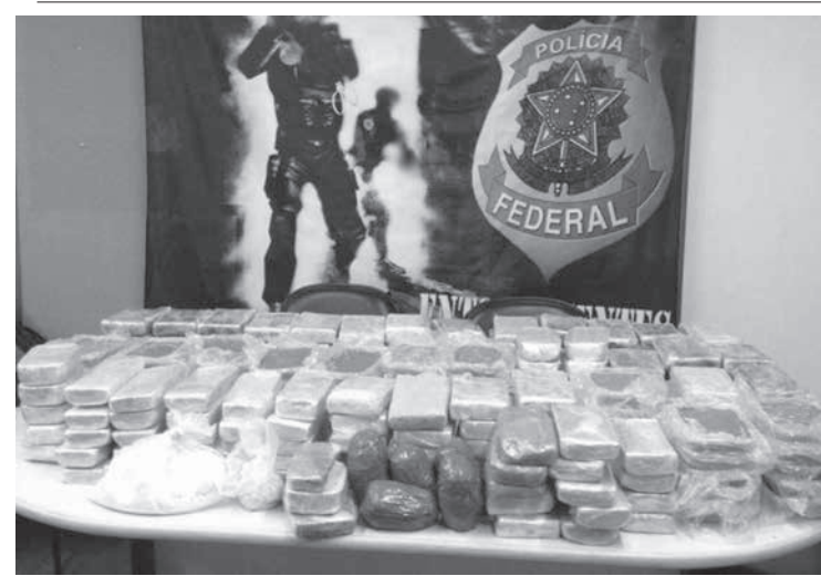
犯罪組織から押収された、229キログラムのコカイン

伯国保健省は10日、麻疹を含む3種混合の予防接種キャンペーンを開始。15日は麻疹撲滅のためのDデー(日本受け入れられるよう、保健所点を設置する。)