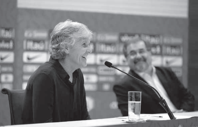
会見の席で笑顔を見せるスンドハーゲ監督

前と比べての変化。多くの伯国選手は欧州でプレーしてきたが、現在は何人かが国内チームに戻ってきている。国内の女子サッカーはテレビやネット中継で見ることが出来、そのことは私が仕事を進める上でとても重要。今回の発表の前も、私は欧州のチームより国内のチームを多く視察した」と語る。