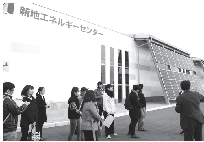
新地エネルギーセンターで説明を受ける研修生ら

宮城県との県境で海通の最北端に位置する新地町は、東日本大震災で10メートルを超す巨大津波に襲われた。その際に電気が途絶えてしまったことを教訓に、自律的で災害に強い持続可能なまちづくりを目指すこととなり、18年に新地エネルギーセンターが設立されることになった。