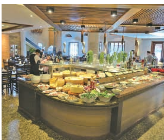
ビュッフェカウンター