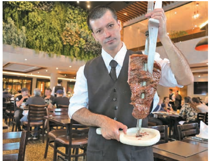
定番のフラウジーニャ

交通アクセスが良く、手頃な値段なのに、旨くてお洒落。評判の人気の店「D'BRESCIA」のシュラスコが、豊富なビュッフェ料理と共に今から79,90レアルで楽しめる。 「D'BRESCIA」は1990年に聖市郊外、サントアンドレ市で開業。店名はシュラスコ発祥の地・南大河州ノーヴァ・ブレシア市に由来する。その名に恥じぬサービス で人気を博し、17年には聖市の中央幹線道路23 de maio 沿いに2店目となるパライゾ店を開いた。 パライゾ店は車のアクセスだけでなく、徒歩で地下鉄ベルゲイロ駅から徒歩でも5分で行ける。吹き抜けの店内は開放感があり、内装はナチュラルモダンテイストの意匠で統一されている。 お勧めはズバリ、シュラスコとビュッフェの食