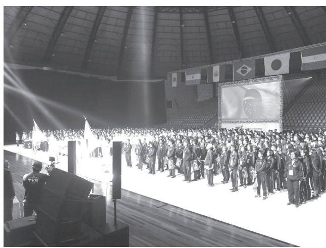
選手全員が整列した様子