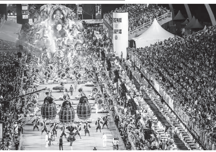
昨年の聖市カーニバルより

今夜21日夜から明日22日未明と22日夜23日未明にかけて、聖市北部アエニビのサンボードロモで、聖市カーニバルのSPグループによるデスファイヤー(パレード)が行われる。この模様はクローボ局で生中継されるが、今年の注目エスココーラは「父よ許したまえ。彼らは無知だった」で、ゴルゴダの丘で十字架に付けられたイエスマンシヤの2年連覇なるか。