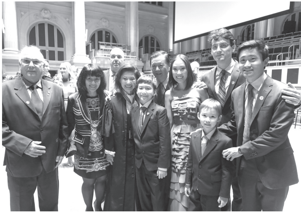
家族・親族と記念撮影