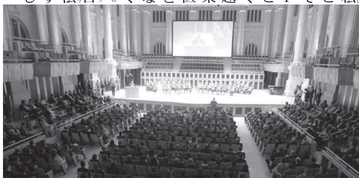
連邦レベルの来賓も多く来たサラ・サンパヴロでの就任の様子