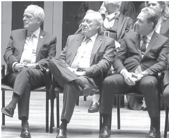
就任の挨拶をするマイラン・マイア長官