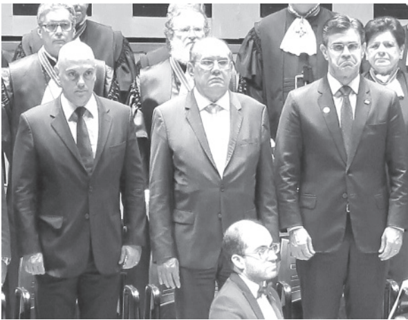
来賓のアレシャンドレ・デ・モラエス最高裁判事とジルマール・メンデス最高裁判事