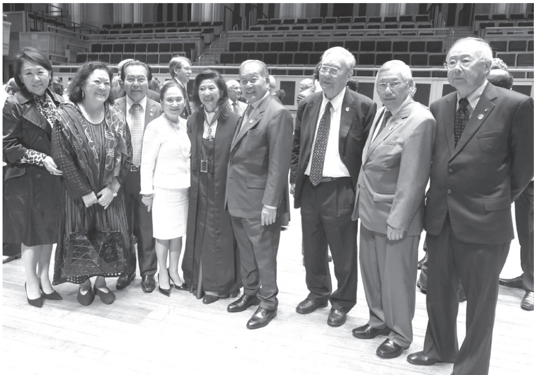
慶祝に駆けつけた日系社会の友人と記念撮影