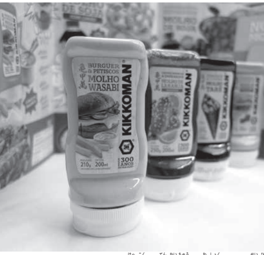
キッコマンが伯国で展開中の和食ソース製品

アの外工場から輸入し、本酒製造会社(の)として販売し、2018年から販売を始めた和食ソース調味料の製造は外部業者に委託している。日本以外では最古の日本酒製造会社(の)と誇り、2018年から販売を始めた和食ソース調味料の製造は外部業者に委託している。日本以外では最古の日本酒製造会社(の)と誇り、2018年から販売を始めた和食ソース調味料の製造は外部業者に委託している。