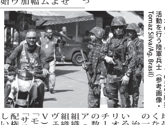
リオ市のファウエーラの治安維持活動を行う陸軍兵士

【既報関連】新型コロナウイルスの感染者や死者が増え、24、25日は急増、26日は死者発生が24、25日付付字紙に報告された。24日夜発表の州保健局の集計は、感染者2271人、死者47人(保健省発表では2201人と46人)だった。感染者最多は聖州で、感染者が65人増えて810人、死者も10人