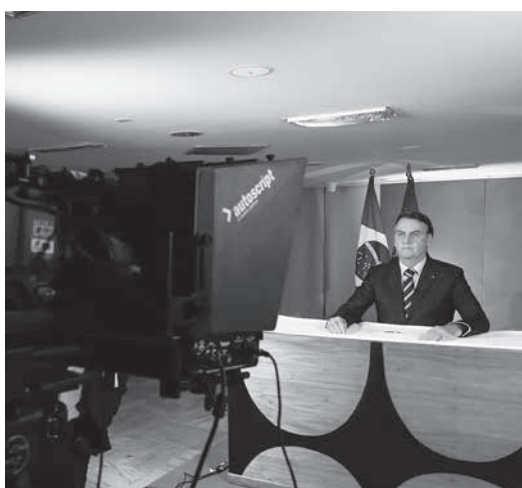
24日のボウソナロ大統領の政見放送

ボウソナロ大統領は、この放送の中で、「ウイルスの蔓延を止め、商店の閉鎖、大量隔離を進めている」と語り、「自治体の長は生活(生計)も守られなければならない。一握の週末に発表されたタック