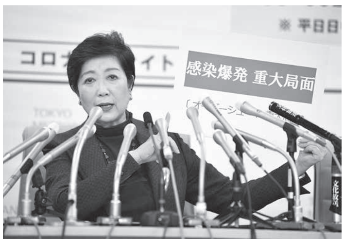
新型コロナウイルスの感染拡大を受け、緊急記者会見する東京都の小池百合子知事。今週末の不要不急の外出自粛を要請した

共同通信の集計では、これまでで最多。うち41人は都道府県による13人は経路が不明で、1日の発表人数としても海外渡航歴があるのは5