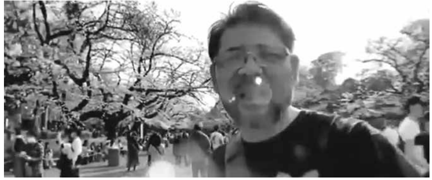
ツイッターで拡散された動画より (twitter@jairbolsonaro より)

い。むしろ、国民の危機意識を喚起している。健康大臣や国の指示を待たず、自ら外出し、自衛隊や学校の閉鎖措置を出して、各州知事に「経済を止めろ」と呼びかけた。対立している。