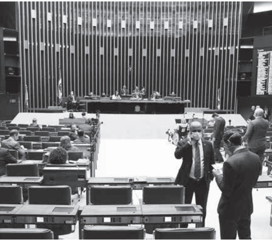
ウイルス感染を避けるため、ビデオ会議で進められた下院での審議 (Pablo Valadares / Camara dos Deputados)