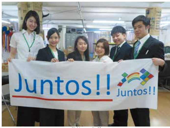
一行 来社した一行