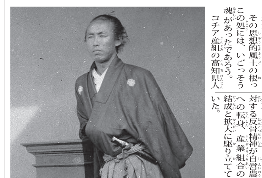
坂本龍馬。慶応2年または3年に上野彦馬が長崎に開業した上野撮影局で撮影された(Public domain)

「人間も自然の一部」の文明に選り、世界中の人々が毎日、戦々恐々として居る。にもかかわらず、大自然を現わしている神は愛の目で人々を見ている。去る3月8日、あ