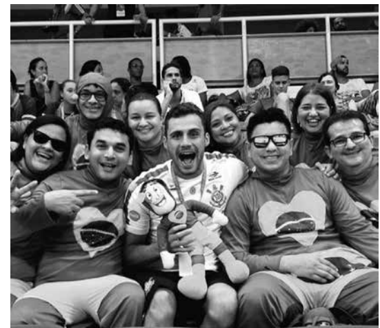
コミカルな着ぐるみをして、伯国選手団の応援に駆け付けるチャボリンズ

オリンピックやパン・アメリカン総合スポーツ選手権などの大会がある。と伯国の応援団は、このチャボリンズ。この団体は、2011年にメキシコのグアダハラで開催されたパン・アメリカン活動している。東京五輪が来年に延期となったので、旅行計画の組み直しを迫られている。 「東京には必ず行く」という。来年と言いつても、開催日時も決まっていない(※)。ホテルの予約も全てやり直さなければならない。東京行きをきらめいていない。 「東京行きの計画はつ