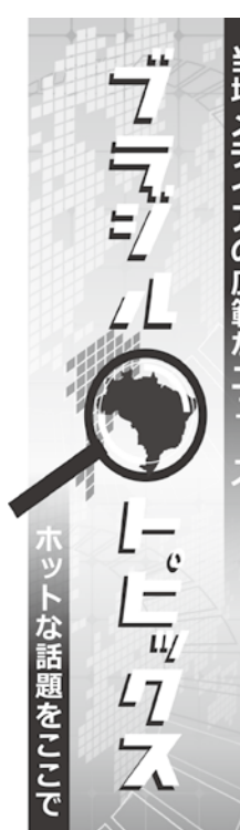
当地メディアの広範なニュース

【既報関連】ブラジル国内の研究者がリオ州、ミナス州、ゴイアス州、南大河州、聖州の新型コロナウイルス感染者の遺伝子情報を解析し、国内での猛威を振るっているウイルスの遺伝子情報を確認した結果、ブラジルでは感染経路が確定出来ない共同体感染が確認された。 感染が起きており、社会的隔離が必要である事が明確になった。 研究の主体は国立科学情報化ラボ(LNCC)で、リオ州調査研究支援財団(FAPESP)、ミナス州調査研究支援財団(FAPESP)、科学技術省、アルボウイルスの発見、診断、ゲノミクス及び疫学のための伯国と英国の共同センター(Ca)