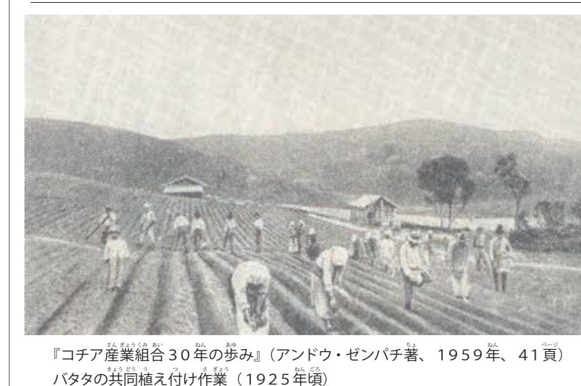
『コチア産業組合30年の歩み』(アンドウ・ゼンパチ著、1959年、41頁) パタタの共同植え付け作業 (1925年頃)

「人間も自然の一部」の文明に選り、世界中の人々が毎日、戦々恐々として居る。にもかかわらず、大自然を現わしている神は愛の目で人々を見ている。去る3月8日、あ