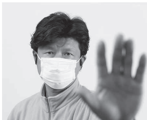
マスクをする男性 (参考写真)

にもかかわらず、大自然を現わしている神は愛の目で人々を見ている。去る3月8日、あ