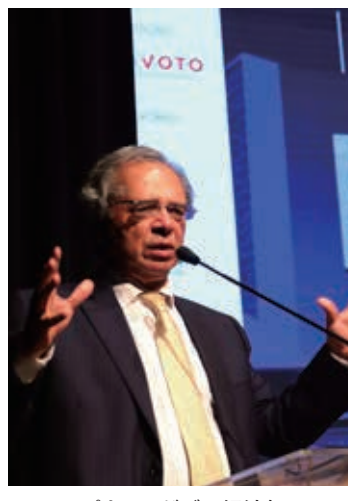
パウロ・ゲデス経済相

【一時解雇】解雇期間は最大60日、雇用主と従業員の間で書面による合意が必要。また、この提案は2日前までに従業員に知らされなくてはならない。年間売上が480万レアル未満の企業は、給与削減の権利は一時解雇中も保たれる。また、会社から遠隔勤務を義務付けられることもなく、失業保険受給申請をする必要もない。政府は、MPに基づき一時解雇が通知されると共に、自動的に労働者の口座に入金する。一時解雇終了後、企業側は一時解雇期間の倍の期間は雇用し続けなくてはならない。2カ月間の解雇された労働者に対しては、最低4カ月間の雇用を保障される。