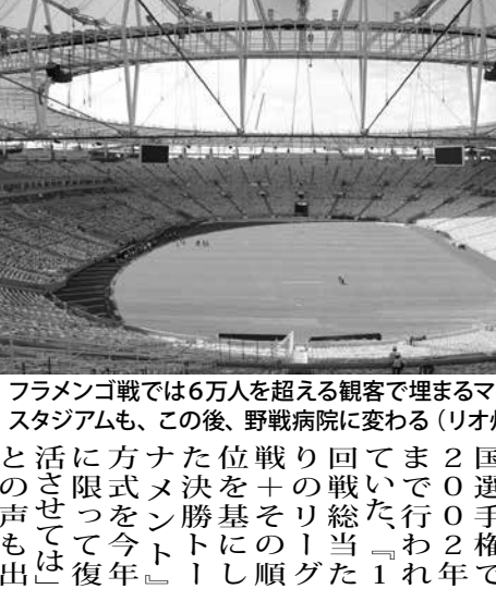
フラメンゴ戦では6万人を超える観客で埋まるマラカナンスタジアムも、この後、野戦病院に変わる

【既報関連】新型コロナウイルス(COVID-19)の感染拡大抑制のため、多くの州や市で外出自粛を求めている中、自分達も感染する可能性がある。市民の生活の質を守るために、市民達が心から感謝の言葉を伝える。その手紙には、「あなたが家族の健康を守らねばならない。私達もあなたに感謝しています」と書かれていた。また、ゴイアス州の生徒達(2512歳)が、医師や看護婦など、医療の現場で働いている人々へ、あなたが家族の健康を守らねばならない。私達もあなたに感謝しています」と書かれていた。また、ゴイアス州の生徒達(2512歳)が、医師や看護婦など、医療の現場で働いている人々へ、あなたが家族の健康を守らねばならない。私達もあなたに感謝しています」と書かれていた。