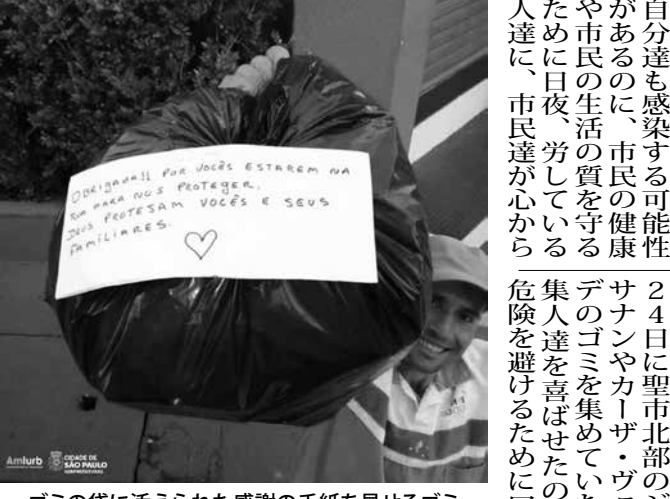
ゴミの袋に添えられた感謝の手紙を見せるゴミ収集人

【既報関連】新型コロナウイルス(COVID-19)の流行に伴い、国内サッカーの試合は3月中旬から中断している。伯国の主要サッカークラブの首脳陣が3月26日、1日からの20日までの間、選手たちに集団休暇を付与することを決めた。COVID-19による感染がさらに拡大した場合、休戦の期限をさらに10日間延長できる。首脳陣からは、選手たちの給料を一律で25%削減する案も出たが、これは選手会側が拒否された。現在中断しているのは州選手権やブラジル杯の試合で、最も重要な大会全国選手権は5月3日から開幕予定だ。7月22日から8月7日まで予定されている東京五輪も来年に延期されたが、もともと、ブラジルの国内サッカーは、その期間中もスケ