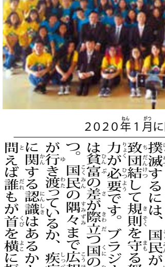
2020年1月に開催された日本語ふれあいセミナー